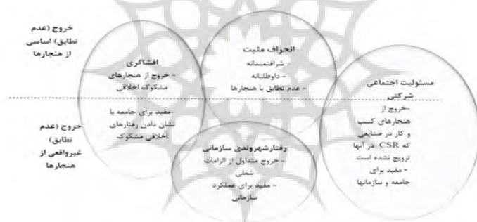
شکل 1: ستخ‌شناسی و رفتارهای انحرافی مثبت

رفتارهای انحرافی مثبت: شامل رفتارهای اجتماعی گرایانه در محیط کار است؛ از جمله: رفتار شهروندی سازمانی، افشاگری، مسئولیت اجتماعی شرکت و خلاقیت یا نوآوری. همه این رفتارهای اجتماعی گرایانه می‌توانند در رفتارهای انحرافی مثبت طبقه‌بندی شوند با رعایت این نکته که از هنجارهای سازمانی پیروی نکنند و داوطلبانه یا ارادی باشند. به عبارتی؛ این دسته از رفتارها خارج از الزامات رسمی شغل‌اند و از فرد انتظار نمی‌رود آنها را انجام دهد؛ اما برای عملکرد سازمان، اثربخش‌اند. در شکل 1، رفتارهای انحرافی مثبت نمایش داده شده‌اند. (اسپریترز و سانشین، 2004)