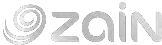
شکل ۱: برند شرکت ام. تی. سی در عراق

روی شرکتهای اسلامی برای ایجاد برندهای قوی وجود دارد. انتخاب نام برند خوب و مرتبط: نامهای برند بسیار مهم است. برندهای اسلامی در این باره بسیار اندیشیده‌اند. ام. تی. سی ۱ نام خود را به «زین» به معنی «زیبا، خوب یا شگفت انگیز» در عربی تغییر داد (موسوی و غفوریان، ۱۳۹۶).