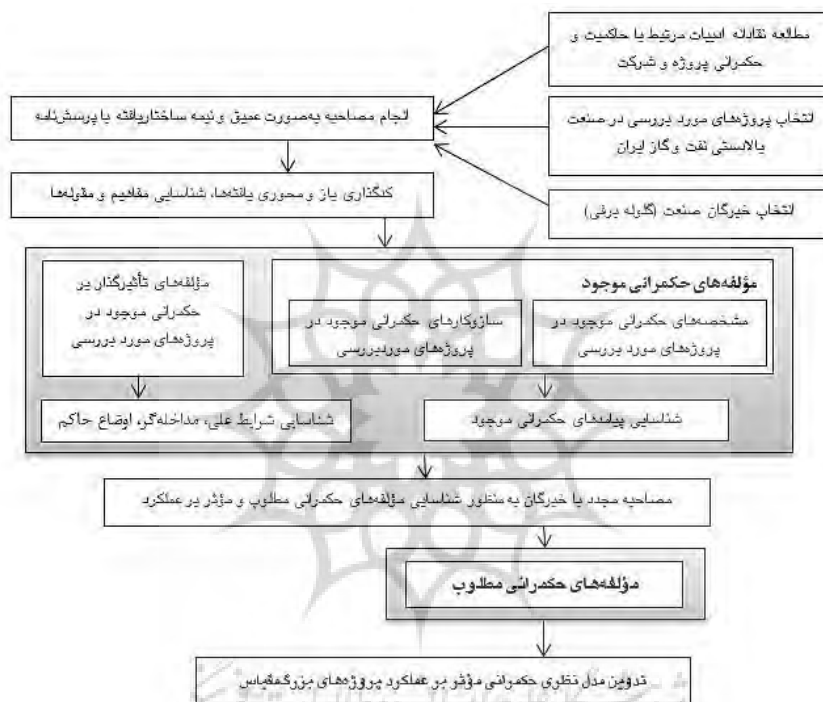
شکل ۱ مراحل اجرایی پژوهش (نگارنده)

مصاحبه‌شوندگان و نبود زمان کافی تهیه شده و سپس پرسش‌نامه توسط مصاحبه‌گر پر شده است. کدگذاری داده‌ها دستی و با نرم‌افزار اکسل صورت گرفته است. بدین منظور گام‌های فرآیندی اجرای پژوهش حاضر به صورت شکل ۱ ترسیم شده است.