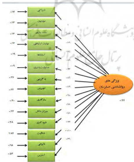
شکل ۳- ضرایب غیر استاندارد مدل برآورد شده