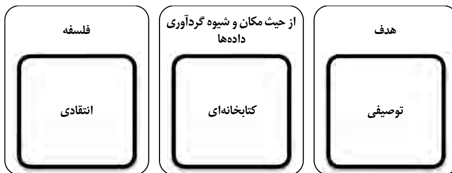
شکل ۱: روش‌شناسی مطالعه حاضر