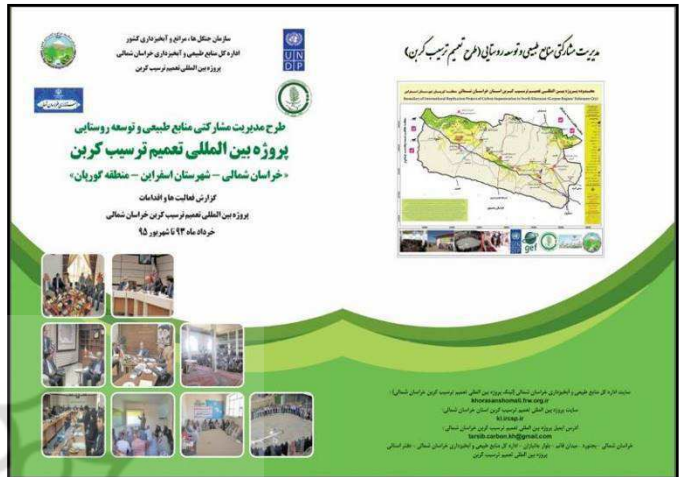
گزارش عملکرد پروژه تعمیم تریسب کرین خراسان شمالی (از خرداد ماه ۱۳۹۳ تا شهریور ماه ۱۳۹۵)