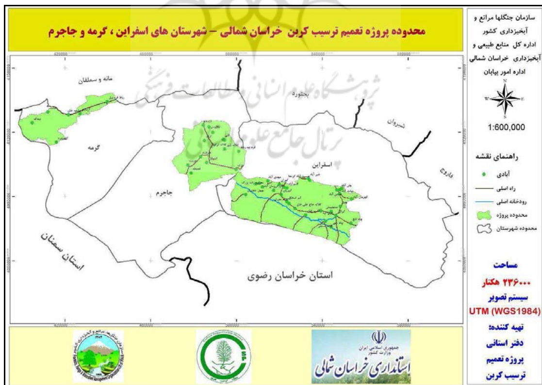
شکل ۱. محدوده پروژه ترسیب کربن در خراسان شمالی