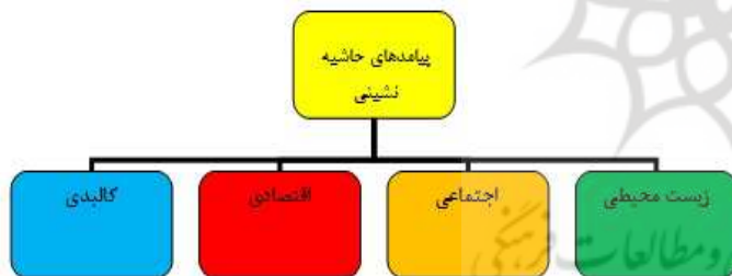
شکل ۴. پیامدهای حاشیه‌نشینی در شهر تبریز

بکارگیری هر یک از راهبردها، پیامدهایی دارد، به‌طورکلی پیامدهای که در راستای بروز پدیده حاشیه‌نشینی در محدوده مورد مطالعه ظهور می‌کنند، در ۴ گروه به شکل ۴ جمع‌بندی می‌شوند: