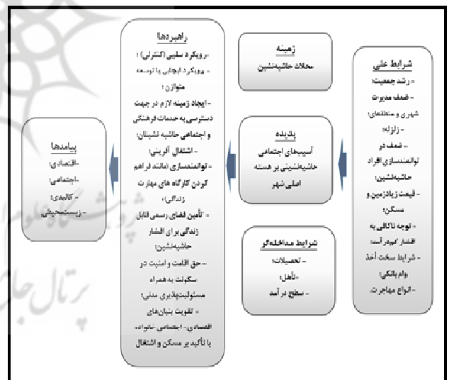
شکل ۲. مدل پارادایمی پدیده مسائل و مشکلات حاشیه‌نشینی،

برای بررسی مسائل و مشکلات حاشیه‌نشینی، آسیب‌های اجتماعی و عوامل تأثیرگذار، شرایط مداخله‌گر و پیامدهای این تغییرات در محلات مورد بررسی در شهر تبریز و برای ایجاد درک عمیق‌تر نسبت به موضوع مورد بررسی، پی بردن به دیدگاه همه‌جانبه نسبت به موضوع و نیز برای برطرف نمودن ابهام بیان‌شده از روش نظریه‌بنیانی استفاده شده است (شکل ۲).