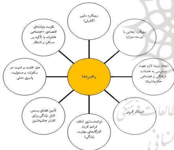
شکل ۳. راهبردهای حل مشکلات حاشیه‌نشینی در محدوده مورد مطالعه

راهبردهای که برای حل مشکلات حاشیه‌نشینی در محدوده مورد مطالعه شناسایی شده است عبارتند از: ۱) رویکرد سلبی (کنترلی)؛ ۲) رویکرد ایجابی یا توسعه متوازن؛ ۳) ایجاد زمینه لازم در جهت دسترسی به خدمات فرهنگی و اجتماعی حاشیه‌نشینان؛ ۴) اشتغال آفرینی؛ ۵) توانمندسازی (مانند فراهم کردن کارگاه‌های مهارت زندگی)؛ ۶) تأمین فضای رسمی قابل زندگی برای اقشار حاشیه‌نشین؛ ۷) حق اقامت و امنیت در سکونت به همراه مسئولیت‌پذیری مدنی؛ و ۸) تقویت بنیان‌های اقتصادی- اجتماعی خانواده با تأکید بر مسکن و اشتغال (شکل ۳).