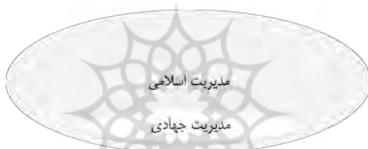
شکل ۱: ارتباط مدیریت اسلامی و مدیریت جهادی (اصلی‌پور، ۱۳۹۵، ص ۵۳)

روستاها و صدها موفقیت علمی و عملی دیگر در سطح کشور همه بیانگر کارآمدی مدیریت جهادی در عرصه‌های سنگین و پیچیده است» (عظیمی و حدائق، ۱۳۸۸). در ارتباط مدیریت جهادی و مدیریت اسلامی «حالت منطقی عموم و خصوص مطلق برگزیده می‌شود؛ چراکه جهاد به‌عنوان وجه تمایز مدیریت جهادی از سایر نظریات مدیریتی، یکی از فروع ده‌گانه دین اسلام شناخته می‌شود» (اصلی‌پور، ۱۳۹۵، ص ۵۴). مدیریت جهادی در گستره قاعده جهاد فی سبیل‌الله متفاوت از سایر سبک‌ها و رویکردهای مدیریتی بروز و ظهور می‌یابد. خداوند متعال می‌فرماید: «کسانی که برای ما مجاهده نمودند، بی‌تردید آنان را به راه‌های خود، راهنمایی می‌کنیم». مطابق این آیه قاعده جهاد فی سبیل‌الله از جنس «رحیمیت» خداوند (محبت خاص خدا) است. براساس این قاعده، خدای متعال تأکید می‌کند آن‌هایی که در راه ما جهاد (نه سعی) می‌کنند، ما حتماً آن‌ها را به راه‌هایی از سوی خود هدایت خواهیم کرد. این راه‌های خدایی، به‌هیچ‌وجه برای دشمن و بلکه غیر مجاهدان از مؤمنان قابل دسترس نیست (احمدیان، ۱۳۹۳، ص ۱۴۳).