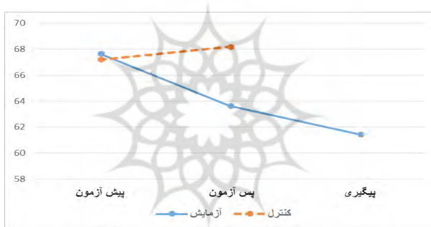
نمودار ۱. وضعیت میانگین نمرات مشکلات اجتماعی

نمودار ۱ وضعیت میانگین نمرات مشکلات اجتماعی را در گروه آزمایش و کنترل نشان می‌دهد.