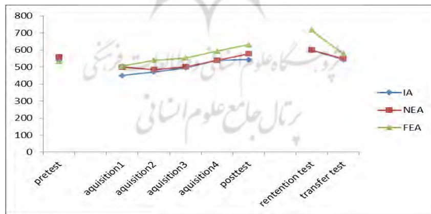
شکل ۲. مقایسه تمرکز توجه بیرونی و دورنی گروه‌ها در مراحل اکتساب، یادداری و انتقال

بر اساس نتایج بدست آمده در جدول شماره ۱ در مرحله پس‌آزمون و یادداری نیز مشاهده می‌شود که گروه توجه بیرونی دور عملکرد بهتری نسبت به گروه‌های دیگر داشته است و پس از این گروه در مرحله پس‌آزمون گروه‌های توجه بیرونی نزدیک و دورنی قرار دارند و در مرحله یادداری پس از گروه توجه بیرونی دور، گروه‌های بیرونی نزدیک و دورنی بطور یکسان عمل کردند. نتایج آزمون تعقیبی نشان داد که بطور معناداری گروه