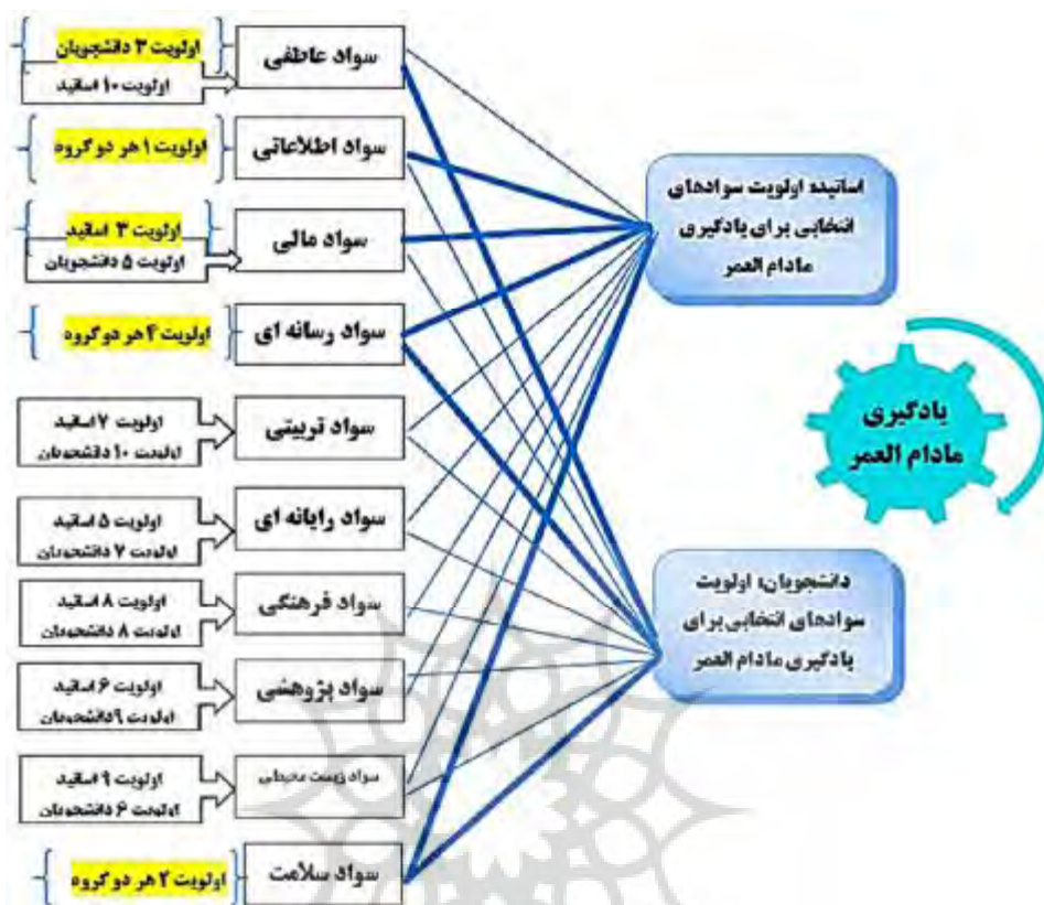
شکل 1. مدل مفهومی اولویت‌های اساتید و دانشجویان

مهري (1386)، شريفی و اسلاميه (1395) و بختیاری و همکاران (1394)، همراستا است. در تبیین این یافته می‌توان گفت همان گونه که علی نژاد و همکاران (1390) نیز در پژوهش خود به این موضوع اشاره کرده‌اند، افزایش سطح سواد اطلاعاتی سبب افزایش مهارت‌های یادگیری مادام‌العمر افراد می‌شود؛ بنابراین انتخاب سواد اطلاعاتی به عنوان اولویت اول در میان سوادها از طرف دانشجویان و استادان سبب ایجاد فرصت‌های کسب دانش در طول عمر افراد خواهد شد.