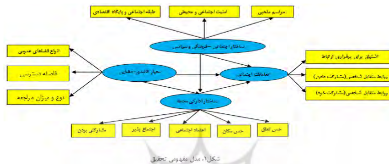
جدول ۱: تعریف عملیاتی هر یک از شاخص‌ها

و ثانیاً: آیا ساختار ادراک محیطی در رابطه بین دو متغیر ساختار اجتماعی - فرهنگی و ساختار کالبدی فضا با متغیر میزان تعاملات اجتماعی دارای اثر میانجی است؟