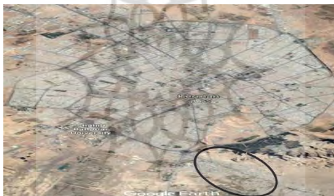
شکل ۲- شهر کرمان و محله سرآسیاب

شهر کرمان به لحاظ نسبی بودن خطر زلزله نیز در سطح بسیار زیاد درجه‌بندی شده است (کمیته دائمی بازنگری آیین‌نامه طراحی ساختمان‌ها در برابر زلزله، ۱۳۹۳) و همچنین از جمله شهرها و مناطق با تراکم جمعیت بالا محسوب می‌شود که بافت‌های فرسوده، فرهنگ سنتی ساختمان‌سازی، عدم توجه کافی به مقوله طراحی در برابر زلزله، عوامل فرهنگی، عدم آمادگی مردم در برابر زلزله و بسیاری از عوامل دیگر دست‌به‌دست هم داده‌اند تا این شهر با ظرفیت خطرپذیری بالایی قلمداد گردد. علاوه بر این، در بین محلاتی که مرکز مطالعات مدیریت بحران شهر کرمان کلاس‌های آموزشی برگزار نموده است، محله سرآسیاب دارای سازه‌های غیرمقاوم با بافت سنتی و همچنین از جمله محلات حاشیه‌نشین شهر کرمان محسوب می‌شود. علاوه بر این ساکنین محله سرآسیاب به دلیل اینکه نسبت به سایر محلات، استقبال بیشتری داشته‌اند به‌عنوان محله مورد نظر در انجام این تحقیق انتخاب شده است.