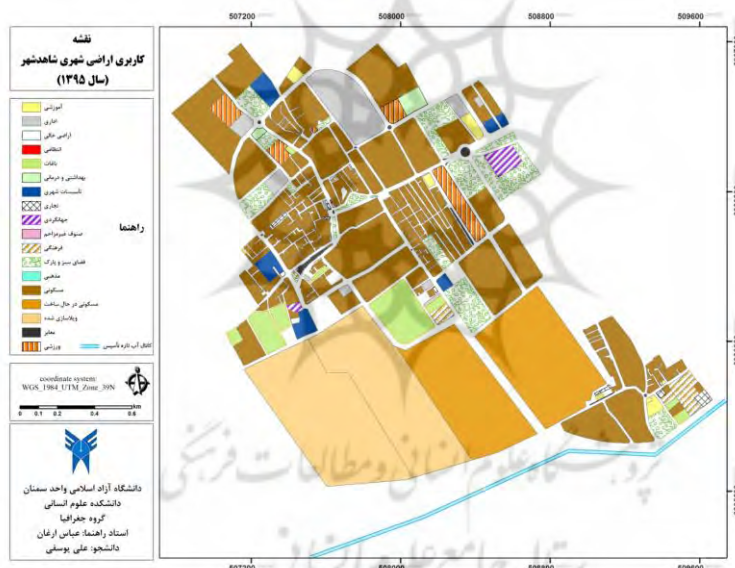
شکل شماره (۲) نقشه کاربری اراضی شاهد شهر در سال ۱۳۹۵