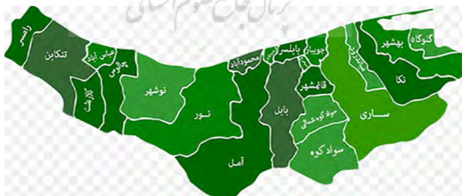
شکل شماره (۲) موقعیت شهرستان قائم شهر در استان مازندران

شهرستان قائم‌شهر در ۲۶ درجه و ۲۱ دقیقه تا ۳۶ درجه و ۳۸ دقیقه شمالی و ۵۲ درجه و ۴۳ دقیقه تا ۵۳ درجه و ۳ دقیقه طول شرقی از نصف النهار گرینویچ قرار گرفته است. این شهرستان ۴۵۸۵ کیلومتر مربع وسعت دارد. شهرستان قائم‌شهر از شمال به شهرستان جویبار، از جنوب به شهرستان سوادکوه، از شرق به شهرستان ساری و از غرب به شهرستان بابل محدود می‌شود. شهرستان قائم‌شهر دارای ۲ شهر، ۲ بخش، ۶ دهستان، ۱۵۶ آبادی دارای سکنه و ۳ آبادی خالی از سکنه است (استاندارداری استان مازندران، ۱۳۹۴). نقشه شماره ۱ موقعیت شهرستان قائم شهر را در استان مازندران نشان می‌دهد.