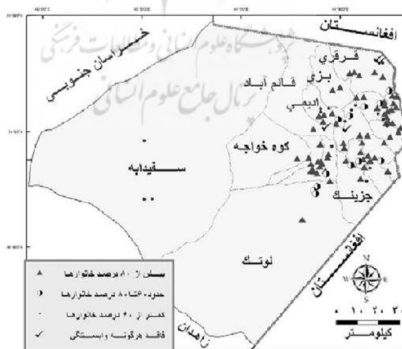
شکل شماره (۱): پراکنش روستاهای منطقه مورد مطالعه در بخش کشاورزی در سال عادی

شهرستان هیرمند در شمال شرق استان سیستان و بلوچستان و از شهرهای واقع در منطقه سیستان است. محدوده مورد مطالعه، از شرق و شمال با کشور افغانستان و از جنوب و غرب به ترتیب با شهرستانهای زهک و زابل همجوار است. این شهرستان دارای دو بخش، ۵ دهستان و ۳۰۳ آبادی است. طبق آماربرداری عمومی نفوس و مسکن سال ۱۳۹۵، حدود ۶۳۹۷۹ نفر جمعیت را شامل می‌گردد (مرکز آمار ایران، ۱۳۹۵). شغل اصلی مردمان این شهرستان کشاورزی است، به طوری که در سالهای اخیر به دلیل موانع موجود در توسعه بخش کشاورزی و عدم تأمین منابع آبی، بخش قابل توجهی از جمعیت این شهرستان مهاجرت کرده‌اند. پراکنش روستاهای وابسته به زراعت در ۲ دوره عادی و خشکسالی مقایسه شده‌اند.