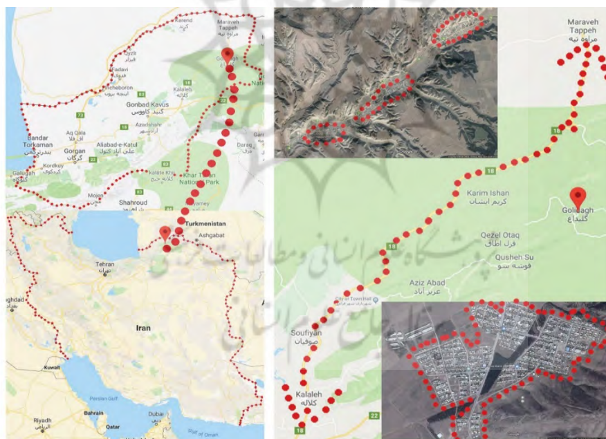
شکل ۱: روستاهای آسیب دیده و محدوده جابه جا شده پس از سیل ۸۴ استان گلستان

بارش باران های شدید در مرداد سال ۱۳۸۴ در نواحی شرقی استان گلستان منجر به وقوع دو سیل ویرانگر شد که از خسارت بارترین سیل های رخ داده در کشور بودند. (محمدی استاد کلایه و همکاران، ۱۳۹۴) بنیاد مسکن انقلاب اسلامی در جهت تأمین اسکان جمعیت آسیب دیده و به منظور کاهش آسیب پذیری کالبدی مجدد روستاها در اثر وقوع سیلاب های آتی اقدام به جابه جایی یازده روستای شهرستان کلالة بانام های قزل اطاق، آق طوقه، چاتال، خوجه لر، کروک، پاشایی، قپان علیا، قپان سفلا، سیدلر، شیخلر و دوجی که در سیلاب های اخیر گرگان رود و سرشاخه های آن خسارات زیادی دیده بودند، به منطقه پیشکمر نمود. (پهلوان زاده و همکاران، ۱۳۹۱) از جابه جایی و تجمیع روستاها در این محدوده، شهر جدید فراغی شکل گرفت. در شکل ۱ موقعیت محدوده مورد مطالعه را نشان داده شده است.