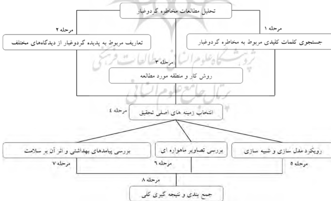
شکل ۲- نمودار جریان‌ی مراحل انجام تحقیق

این تحقیق، بر اساس پژوهش کتابخانه‌ای و جستجوی مقالات معتبر ملی و خارجی در مورد بحران گردوغبار تدوین یافته و فاقد داده‌پردازی است. سعی شده که تغییرات زمانی و فضایی را به طور کلی در جنوب و جنوب غرب کشور با استفاده از منابع مطالعاتی موجود و قابل دسترس و چالش‌های این پدیده را در گذشته و حال تحلیل نماید تا منظر جدیدی از نحوه اعمال مدیریت جامع سرزمین و مدیریت خطرات محیطی در ایران را با تمام مسائل و مشکلاتی که این پدیده ایجاد می‌کند در حال حاضر ارائه نماید (شکل ۲).