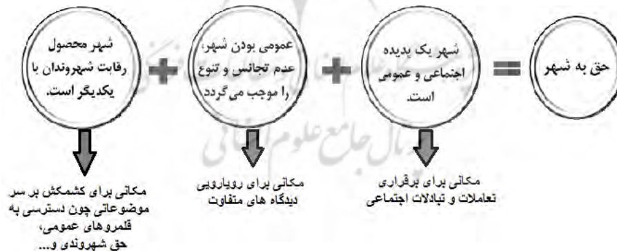
شکل ۱- حق به شهر از منظر لوفور (Mitchell, 2003).

هاروی "حق به شهر" را نوعی از حقوق بشر می داند و در توضیح آن می نویسد: حق به شهر بسیار فراتر از آزادی فردی در دسترسی به امکانات شهری است. حق به شهر حق تغییر دادن خودمان از طریق تغییر دادن شهر است. آزادی ساختن و بازساختن شهرها و خودمان یکی از باارزش ترین و درعین حال فراموش شده ترین، حقوق بشر است (هاروی، ۱۳۹۱: ۱۵). در این میان لوفور، حق به شهر را حق به زندگی شهری می نامد؛ او این حق را یک حق جمعی می داند که به یک مکان معین مربوط می شود. مؤلفه های اساسی این حق عبارت اند از: مشارکت شهروندان در فرآیند برنامه ریزی، تضمین دسترسی شهروندان به برنامه ریزی طراحی و مدیریت شهری، هدایت متوازن و برابری طلبانه کاربری زمین برای دسترسی همگانی به مسکن، کار، بهداشت و آموزش، حمل و نقل عمومی و فضای عمومی، اوقات فراغت و زندگی طولانی، تضمین دسترسی شهروندان کم درآمد به مسکن مناسب و ساماندهی اسکان غیررسمی، استفاده ی مشترک شهروندان از فضاهای عمومی با اختصاص پهنه های ویژه برای امور اجتماعی در شهر (هاروی و مری فیلد، ۱۳۹۱: ۷۵).