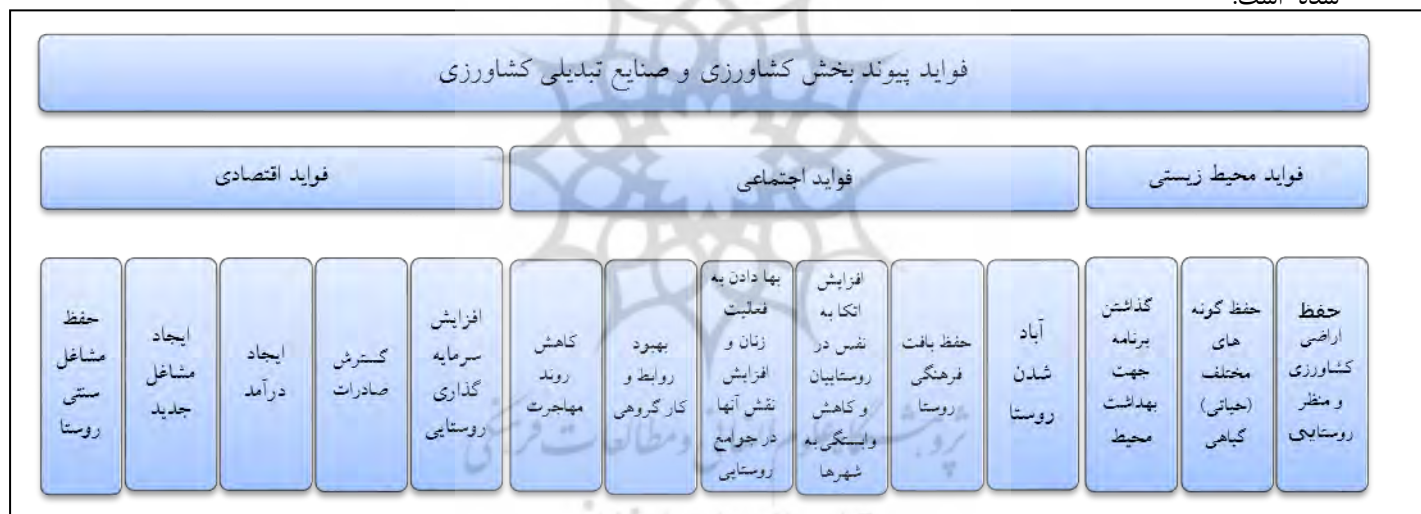
شکل ۱- فواید پیوند کشاورزی و صنایع روستایی

کشاورزی و به ویژه کشاورزی تولیدی، مشتری مهم نهاده‌های محلی مرتبط با مزرعه و نهاده های مشاغل خدماتی است. همچنین کشاورزی می تواند محصولاتی را برای فرایندهای محلی یا صنایع (مشاغل کشاورزی و صنایع غذایی فراهم کند (Rezvani and et al, 2014:24). در مکتب رهووت، توسعه همه جانبه روستایی به تحول بخش کشاورزی به عنوان محرک اصلی نظر دارد و بدین منظور یک تغییر تدریجی اما حتمی از کشاورزان معیشتی به کشاورزان تجاری پیش بینی می‌شود که در آن صورت وابستگی کامل کشاورزی به صنایع تبدیلی، قطعی خواهد بود (Papeli Yazdi and Ebrahimi, 2002:56). همچنین راهبردی است که فقر روستایی را کاهش داده و با توسعه صنایع از دیدگاه اقتصاد روستایی و اقتصاد ملی، توسعه متعادل میان خانوارهای شهری و روستایی، بخش کشاورزی و صنعت و تعادل در اقتصاد منطقه ای و تمرکز زدایی صنعتی و شهری را میسر می سازد (Barghi and et al, 2014:132). پتانسیل بالای صنایع خانگی (مثلا بسته بندی محصولات) جهت ایجاد اشتغال ثابت شده است (Thanaga joy and kani, 2013:2). به کارگیری صنایع تبدیلی در کنار فعالیت‌های بخش کشاورزی به طور کلی دارای فواید متعدد اقتصادی، اجتماعی و زیست محیطی می‌باشد که به اختصار در شکل ۱ نشان داده شده است.