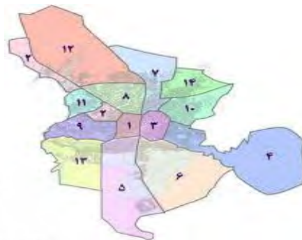
شکل ۲. نقشه مناطق پانزده‌گانه شهر اصفهان مأخذ: https://socialpathology3.ut.ac.ir

طبق منطقه‌بندی شهرداری اصفهان از سال ۱۳۹۲، شهر به ۱۴ منطقه تقسیم شده است (شکل ۲).