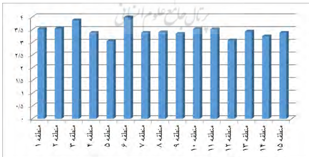
شکل ۳. نمودار میانگین شاخص‌های مدیریت شهری (در بعد جهانی‌شدن)، به تفکیک مناطق پانزده‌گانه