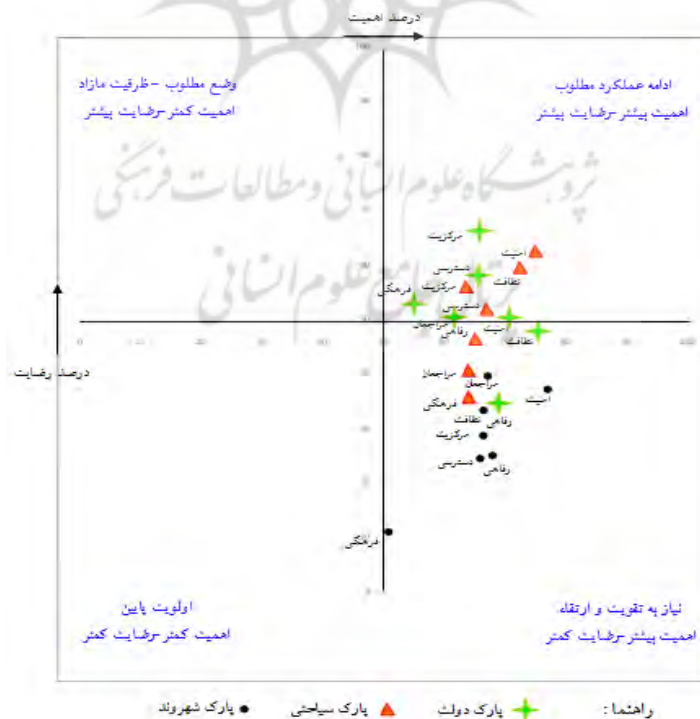
نمودار ۲- رضایت- اهمیت معیارهای بررسی شده در پارک‌های مدنظر

ترسیم نمودار رضایت - اهمیت، روشی است تا براساس نمایش وضع موجود رضایتمندی با لحاظ نظرات شهروندان درباره سطح اهمیت، راهبرد لازم برای بهبود وضعیت یا تثبیت وضعیت فعلی به کار گرفته شود. برای ترسیم این مقدار از روش‌های مختلفی استفاده می‌شود که یکی از گویاترین و ساده‌ترین روش‌ها، استفاده از میزان (درصد) رضایت و اهمیت و لحاظ سطح میانه (۵۰) برای نقطه تقاطع مبدأ مختصات است. بر این اساس نمودار رضایت و اهمیت برای نتایج پژوهش به صورت نمودار (۲) ترسیم شد.