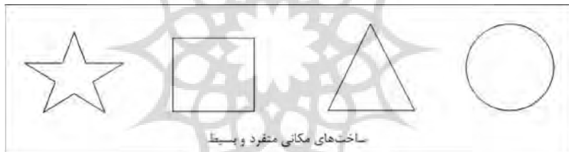
تصویر شماره ۱: مفهوم تصویری مکان (Hafeznia, 2006: 159).

در علم نجوم هم همین‌گونه است، هر چه ما درباره خورشید بگوییم قضایای شخصیته است. حجم خورشید این اندازه است، از فلان تاریخ به وجود آمده است و ... همچنین این موارد عوارض ذات خورشید هم نیست یعنی می‌شد که خورشید در این فاصله نباشد، جغرافیا نیز همین‌گونه است برای مثال جغرافیای عراق، جغرافیای اسپانیا که قضایای کلی نیستند. این سوی دنیا در این نقطه یک عرض جغرافیایی خاص وجود دارد و آن سوی، چیز دیگری وجود دارد. لذا نتیجه این می‌شود که اگر وحدت موضوع در علم پذیرفته شود علم غیرکلی نمی‌تواند وجود داشته باشد و باید از فهرست علوم، دانش‌های جزئی را خارج کرد و به همین دلیل این علوم در گذشته محل اعتنا نبوده است (Sorush, 1995: 70-71). فضا و مکان نیز که هسته علم جغرافیا را تشکیل می‌دهد، به صورت ساخت‌هایی منفرد و بسیط می‌باشند و گزاره‌های حاصل از آنها نیز شخصی خواهد بود (تصاویر شماره ۱ و ۲).