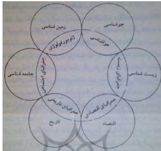
شکل شماره ۱: محیط اطراف جغرافیا (Jensen, 1997:17).

وی در بخش دیگری از همان کتاب می نویسد: این دیدگاه که جغرافیا رشته‌ای ترکیب کننده می باشد همواره برای فلسفه این رشته امری اساسی بوده است. اعتقاد به ترکیب، تئولوژی جغرافیا بوده، منظوری که فعالیت‌های جغرافی دانان را توجیه کرده است. وی در ادامه می‌افزاید، جغرافیای مدرن کمی یا انتقادی، ایده ترکیب را رها نکرده است. بسیاری از محققین برجسته و پیشقراول از طریق آشکال جدید تحلیل، درگیر کاوشی برای ترکیب بوده‌اند. پیتر هاگت کتاب درسی خود را «جغرافیا ترکیبی نو» خواند. «بونج» یکی از جغرافی دانان منتقد در سال ۱۹۷۳ اظهار داشت که جغرافیا علمی پیوند دهنده است (Ibid: 155). حال اگر به فرض بنیادی علم جغرافیا (رابطه متقابل انسان و محیط) دقیق‌تر توجه کنیم، نکات ظریفی را از آن به دست می‌آوریم که برای تبیین ماهیت این علم بسیار سودمند است. ذیلاً به برخی از این نکات اشاره می‌کنیم: ۱- عناصر مندرج در علم جغرافیا: الف) انسان ب) محیط (طبیعت) ۲- «رابطه» میان دو عنصر یاد شده ۳- قلمرو و محدوده مطالعاتی جغرافیا ۴- «ترکیب» انسان و طبیعت در جغرافیا. همان‌طور که ملاحظه می‌کنیم، این پرسش به وجود می‌آید که، آیا مقصود از مطالعه جغرافیایی، مطالعه در مورد عنصر انسان مندرج در جغرافیا به صورت مجزاً است؟ به عبارت دیگر آیا مقصود از جغرافیای انسانی، مطالعه صرف مسائل مرتبط با انسان نظیر سیاست، اقتصاد،