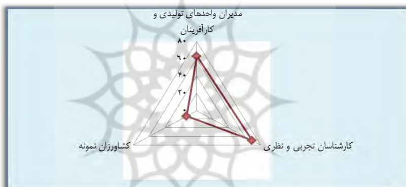
شکل ۲- نمودار تعداد مفاهیم استخراجی نمونه‌های مطالعه شده