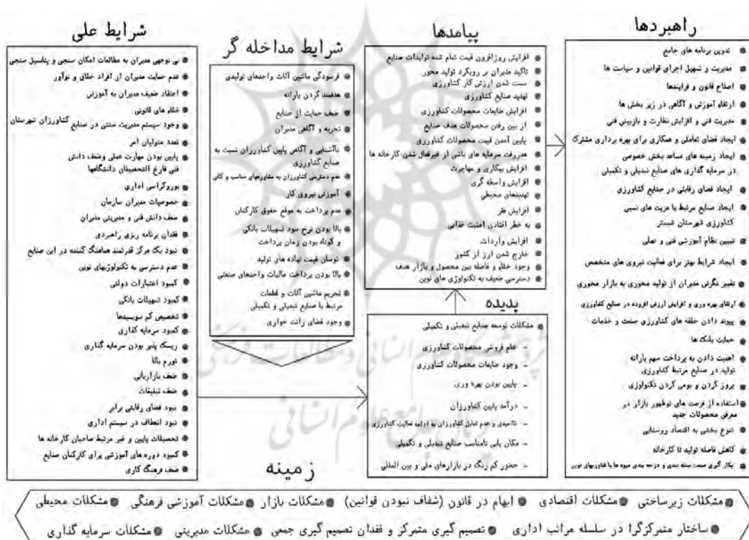
شکل ۴- مدل پارادیمی چالش‌های پیش‌روی صنایع تبدیلی و تکمیلی شهرستان شبستر

راهبرد، مکانیزم و تدبیری است که در برخورد با پدیده به کار گرفته می‌شوند. به منظور رفع چالش‌ها و مشکلات به وجود آمده و همچنین وجود زمینه و شرایط مداخله‌گری، راهبردهای متناسب با آن‌ها اتخاذ می‌شود. با وجود پدیده مشکلات توسعه صنایع تبدیلی و تکمیلی که خود ریشه در عوامل متعدد دارد، کنشگران به تدابیری برای برخورد با این پدیده دست می‌زنند (شکل ۴).