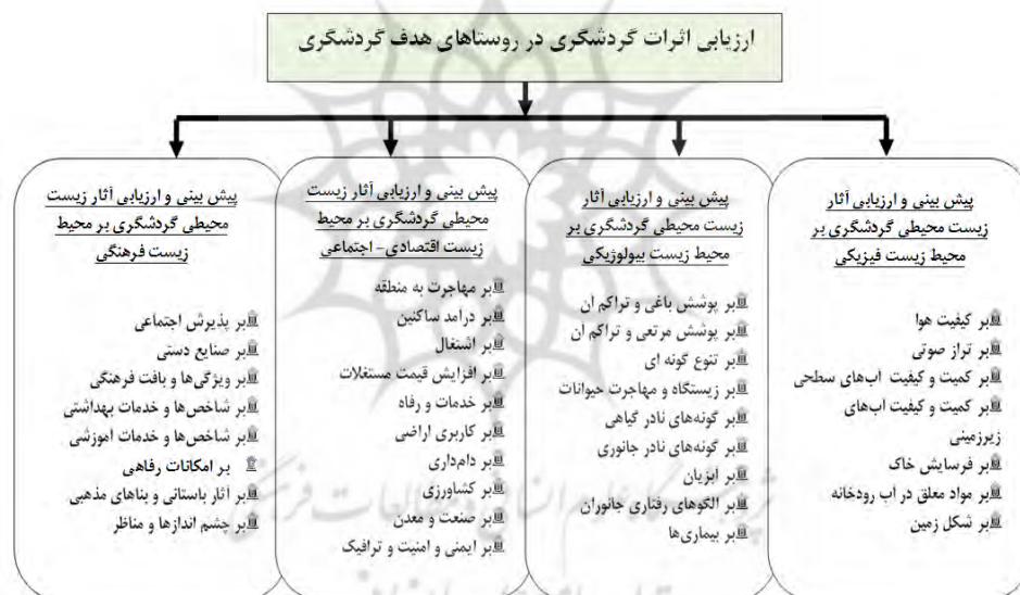
شکل ۱- ابعاد ارزیابی اثرات گردشگری بر روستاهای مطالعه‌شده

و پیشگیری (UP))، و مدت زمان مورد نیاز برای بروز اثر (با سه نماد M, L و I به ترتیب بیان‌کننده وقوع فوری، میان‌مدت و درازمدت اثر) محاسبه می‌شود. در این تحقیق هدف سنجیدن تأثیر فعالیت‌های گردشگری بر زیرفاکتورهای محیط زیستی (شامل بعد محیط زیست فیزیکی، شیمیایی، اقتصادی و اجتماعی و فرهنگی است) است که در قالب ماتریسی به سنجش تمامی اثرات ریزفعالیت‌ها بر این ابعاد و امتیازبندی هر یک از آن‌ها پرداخته می‌شود. در نهایت پس از استخراج ارزش کمی و ارزش بهنجار شده اثرات ناشی از فعالیت‌های و زیرفعالیت‌های حوزه گردشگری برای هر یک از عوامل اکولوژیک، غربال-سازی و گزینش صورت می‌گیرد. نخست بهتر است این اقدام به صورت کیفی صورت گیرد و بعد کمی شود (شکل ۱).