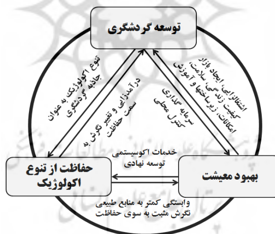
شکل ۲- ابعاد مثبت ارتباط بین توسعه گردشگری، محیط زیست و بهبود معیشت روستایی

اساس امروزه صاحب‌نظران بر رویکردهای پایدار گردشگری تأکید دارند که در آن تلاش می‌شود آثار زیست‌محیطی گردشگری به حداقل کاهش یابد. رویکرد گردشگری پایدار به‌عنوان شکلی از گردشگری جایگزین، در پی بهبود کیفیت زندگی ساکنین محلی، ارتقای تجربیات گردشگران و حفظ محیط زیست مقصد است (گریس چوی و سیریکایا، ۲۰۰۵، ص. ۳۸۱). امروزه با توجه به نقش گردشگری در تنوع بخشیدن به اقتصاد محلی، شکلی از گردشگری در قالب گردشگری روستایی مطرح است که در آن روستاها به‌عنوان مقاصد گردشگری به منظوره‌های مختلفی نظیر بازدید از معماری روستا، بناهای بومی و یا طبیعت بکر روستا و فرهنگ و آداب و آیین مذهبی و اجتماعی ویژه آن مورد بازدید گردشگران مختلف قرار می‌گیرند (پروازی، ۱۳۸۹، ص. ۱۴۸). مطالعات و پژوهش‌های انجام‌شده در زمینه گردشگری در ایران و دیگر کشورها نشان‌دهنده پیامدهای مثبت و منفی این پدیده در ابعاد و زمینه‌های مختلف است (کیم، ایسال و سیرجی، ۲۰۱۳ ۲ ؛ اندرک و نایپن، ۲۰۱۱ ۳ ؛ ونگ، فوو، جسیل و آگوستیس، ۲۰۰۶ ۴ ) (شکل ۲).