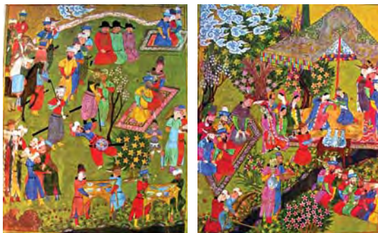
تصاویر ۳۱ و ۳۲. از راست به چپ: نگاره‌های ۱۱ و ۱۲.

سایر عناصر مصنوع و تزیینی: در بررسی عناصر مصنوع و تزیینی می‌تواند به آلاچیق‌ها، نرده‌ها، نقوش فرش و چادرها و تخت‌ها و صفاها و پیاده‌روها اشاره کرد (بهبهانی، ۱۳۸۱: ۹۵). استفاده از نقوش گیاهی و اسلیمی در طراحی بناهای کوشک و استفاده از آلاچیق‌های منقوش به طرح‌های گیاهی و به کارگیری چادرها و فرش‌هایی با طرح گل گواه بر وجود عناصر تزیینی در باغ است. در نگاره ۱۳ کتیبه‌های عربی نیز در بالای سردر عمارت دیده می‌شود. مقیاس کتیبه و نرده به عنوان عناصر تزیینی در نگاره ۶ (تصویر ۳۰) و هم چنین مقیاس عناصر معماری