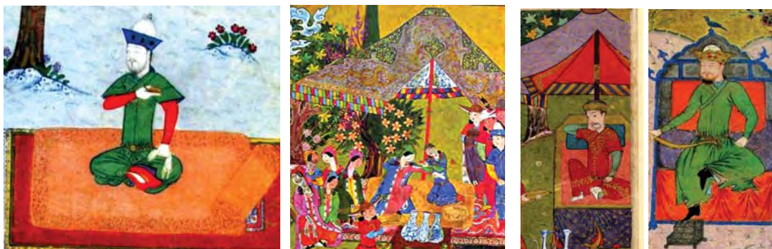
تصاویر ۲۵ و ۲۶ و ۲۷ و ۲۸ از راست به چپ: نگاره ۷. مأخذ: آژنده، ۱۳۸۷: ۲۶۹ و نگاره ۸. مأخذ: شایسته فر، ۱۳۷۹: ۶ و نگاره ۱۱. مأخذ: تنهایی، ۱۳۸۷: ۱۵۱ - نگاره ۵. مأخذ: آژنده، ۱۳۸۷: ۲۶۶

عارف بزرگ قرن هفتم و هشتم بود که در تبریز به تخت نشست. پس از او توسط یکی از نوادگانش به نام اسماعیل شهر قزوین به عنوان پایتخت قرار داده شده و پس از او شاه عباس پایتخت را از قزوین به اصفهان منتقل کرد (پیرنیا، ۱۳۸۷: ۲۷۳) از آثار مهم این دوره به فرمان شاه می توان به خیابان چهارباغ اشاره کرد. خیابان چهارباغ در منطقه پرجمعیتی از شهر با حالت تفرجگاهی و گردشگری بوده که در آن ۴ نهر آب (ویلبر، ۱۳۸۷: ۱۱۲) و اطراف آن باغات سلطنتی وجود دارد (پیرنیا، ۱۳۸۷: ۲۷۶).