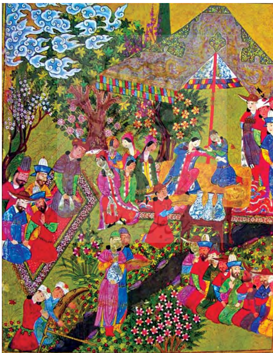
شاهنامه شیراز، سرلوح ۲ برگی ضیافت در گلگشت، مأخذ: تنهایی (۱۳۸۷:۱۵۱)