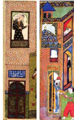
تصاویر ۲۹ و ۳۰. عمارت کوشک و اندرونی، از راست به چپ: نگاره‌های ۱۳. و نگاره ۶.

گیاهان و نظام کاشت: گیاهان در باغ ایرانی با اهداف مختلف کاشته می‌شود که می‌توان به استفاده از محصول، تزیین باغ، ایجاد سایه، تأکید بر محور اصلی، چشم انداز و