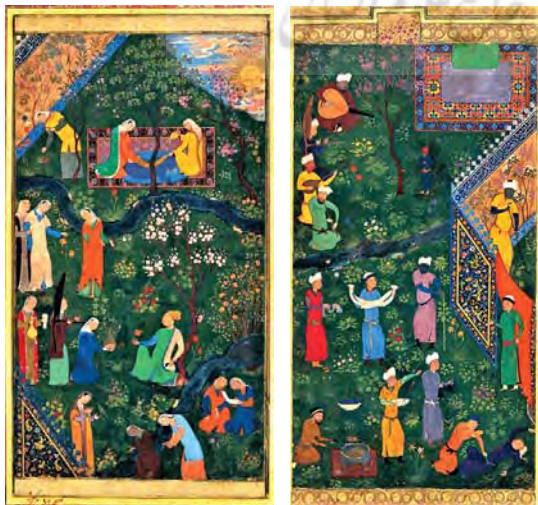
تصاویر ۸ و ۹. باغ حسین بایقرا، کار بهزاد. مأخذ: ویلبر، ۱۳۸۷: ۷۳ و ۷۳

مکتب نگارگری شیراز به تعبیر، ام المکاتب ایران در قلمرو کتاب آرایبی است. گرچه به خاطر فرهیختگی و طراحی طیف رنگی به پای مکاتب تبریز و هرات و اصفهان نرسید ولی از حیث تداوم و استمرار و تجربه بدان‌ها پیشی گرفت. سر چشمه‌های این مکتب در ایران پیش از اسلام ریشه بسته است و بعد از اسلام نشانه‌های آن در تصویرگری