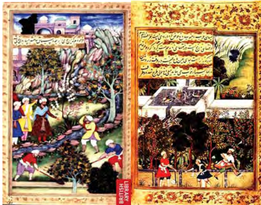
تصاویر ۳ و ۴ و ۵ و ۶. باغ وفا.