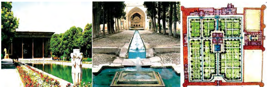
تصاویر ۱۰ و ۱۱ و ۱۲. از راست به چپ پلان باغ فین، تصویر باغ فین، عمارت چهل ستون.