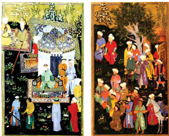
تصاویر ۱ و ۲. تیمورلنگ در یکی از باغ‌های سلطنتی از ظفرنامه علی یزدی، مأخذ: TIMUR GRANTING, 2014-ULUC, 2014

روش تحقیق در این مقاله به صورت توصیفی-تحلیلی و شیوه جمع‌آوری اطلاعات استناد به منابع کتابخانه‌ای و روش تجزیه تحلیل کیفی بوده است. انتخاب تصاویر نیز بر اساس موضوع مورد بررسی باغ ایرانی است. این مقاله در سه بخش تنظیم گشته است: در بخش آغازین نگارگری مکتب شیراز در دوره‌های مختلف و دلایل اوج شکوفایی آن بررسی شده است و در بخش بعدی با استناد به منابع