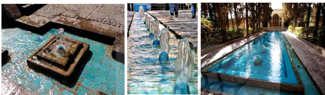
تصاویر ۱۳ و ۱۴ و ۱۵. نظام آب در باغ فین کاشان.