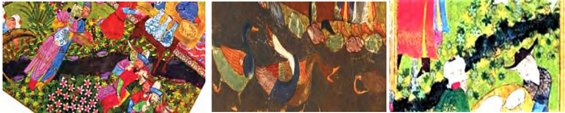
تصاویر ۱۶ و ۱۷ و ۱۸ از راست به چپ: نهرهای مربوط به نگاره ۶. مأخذ: آژند، ۱۳۸۷: ۲۶۷ و نگاره ۹. مأخذ: شایسته فر، ۱۳۷۹: ۷۳ و نگاره ۱۱. مأخذ: تنهایی، ۱۳۸۷: ۱۰۱