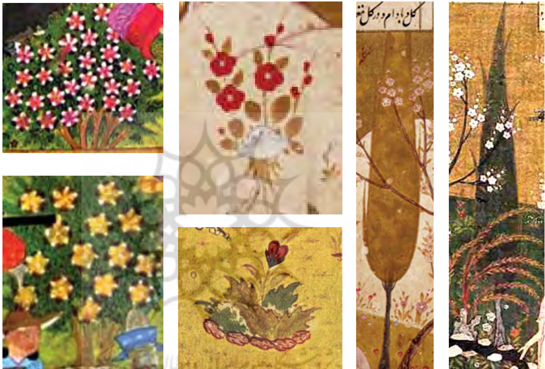
تصاویر ۱۹ و ۲۰ و ۲۱ و ۲۲ و ۲۳ و ۲۴ از راست به چپ: گل‌های نگاره ۱. مأخذ: PERSIAN PAINTING, 2014 و نگاره‌های ۲ و ۳. مأخذ: شایسته فر، ۱۳۷۹: ۲۹ و نگاره ۹. مأخذ: همان: ۷۳ و نگاره‌های ۱۱ و ۱۲. مأخذ: تنهایی، ۱۳۸۷: ۱۰۱ و ۱۴۹

محصور با دیوارهای چوبی که کوشک در آن است و خندقی آکنده از آب، دور آن و حیوانات در آن قرار دارد (ویلبر، ۱۳۸۷: ۶۲-۶۴؛ تصویر ۷). از جمله باغ‌های این دوره می‌توان به موارد ذیل اشاره کرد: