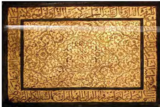
تصویر ۲ جلد قرآن صحافی با گل اسلیمی و کتیبه ای، اوایل قرن ۱۱ هـ ق، جنس: چرم، تکنیک: مهری، ابزارکاری، و طلاکاری، ابعاد: ۲۴،۱×۲۷ cm (۱،۸۷)، مأخذ: همان.