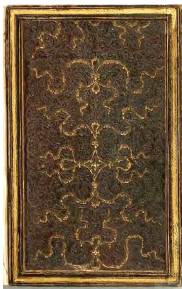
تصویر ۶. جلد کتاب، قرن ۱۰ هـ ق، جنس: چرم، تکنیک ساخت: ضربی و طلاکاری، ابعاد: (14×35.8×9.2cm)، مأخذ: همان.