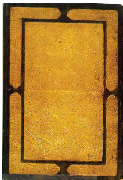
تصویر ۵. جلد کتاب، قرن ۱۰ هـ ق، جنس: چرم، تکنیک ساخت: ضربی و طلاکاری، ابعاد: (14×35.8×9.2cm)، مأخذ: همان.

شریحی از روش رسم نقوش ماری جهت برداشت بهتر از این دسته‌بندی‌ها ارائه گردد. نقوش ماری متشکل از اسکلت‌های مختلفی هستند و به تبع آن روش رسم هر کدام متفاوت است. اما آنچه که در تمامی این روش‌ها یکسان است پیروی از ساختار مبتنی بر گردش میان دایره‌هاست. در ادامه به بیان این روش‌ها در دو بخش غیرقرینه و قرینه با استفاده از الگویی بصری پرداخته خواهد شد.