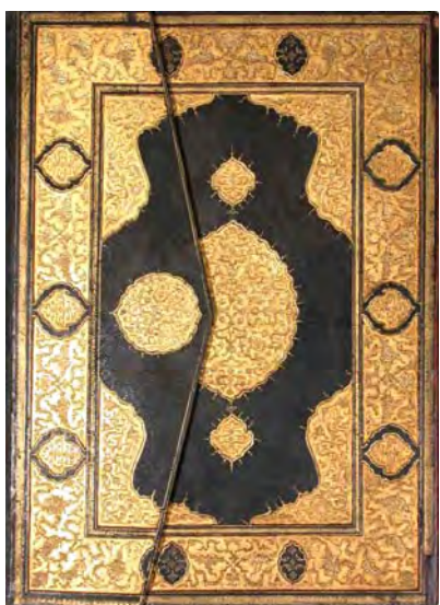
تصویر ۴. نسخه خطی قرآن، اواخر ۱۶ و اوایل قرن ۱۷م، جنس: چرم طلائی، تکنیک ساخت: ضربی طلاکاری، رنگ: آبرنگ مات، جوهر، طلا، مأخذ: همان.