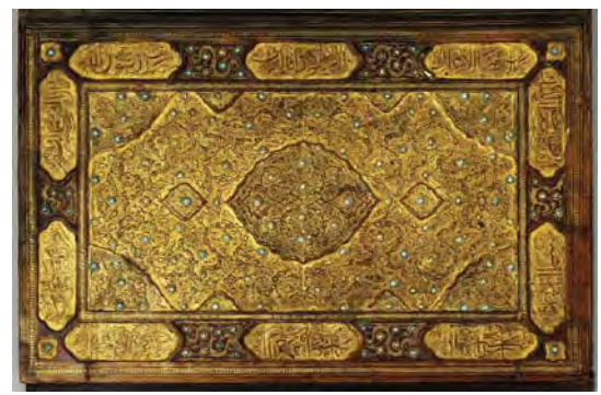
تصویر ۱ جلد قرآن طلاکوب و فیروزه نشان، قرن ۱۰ هـ ق، جنس: چرم، تکنیک ساخت: ضربی، رنگ: طلاکاری شده و فیروزه نشان، ابعاد: (جلد کاملاً باز ۲۷×۲۸،۶)