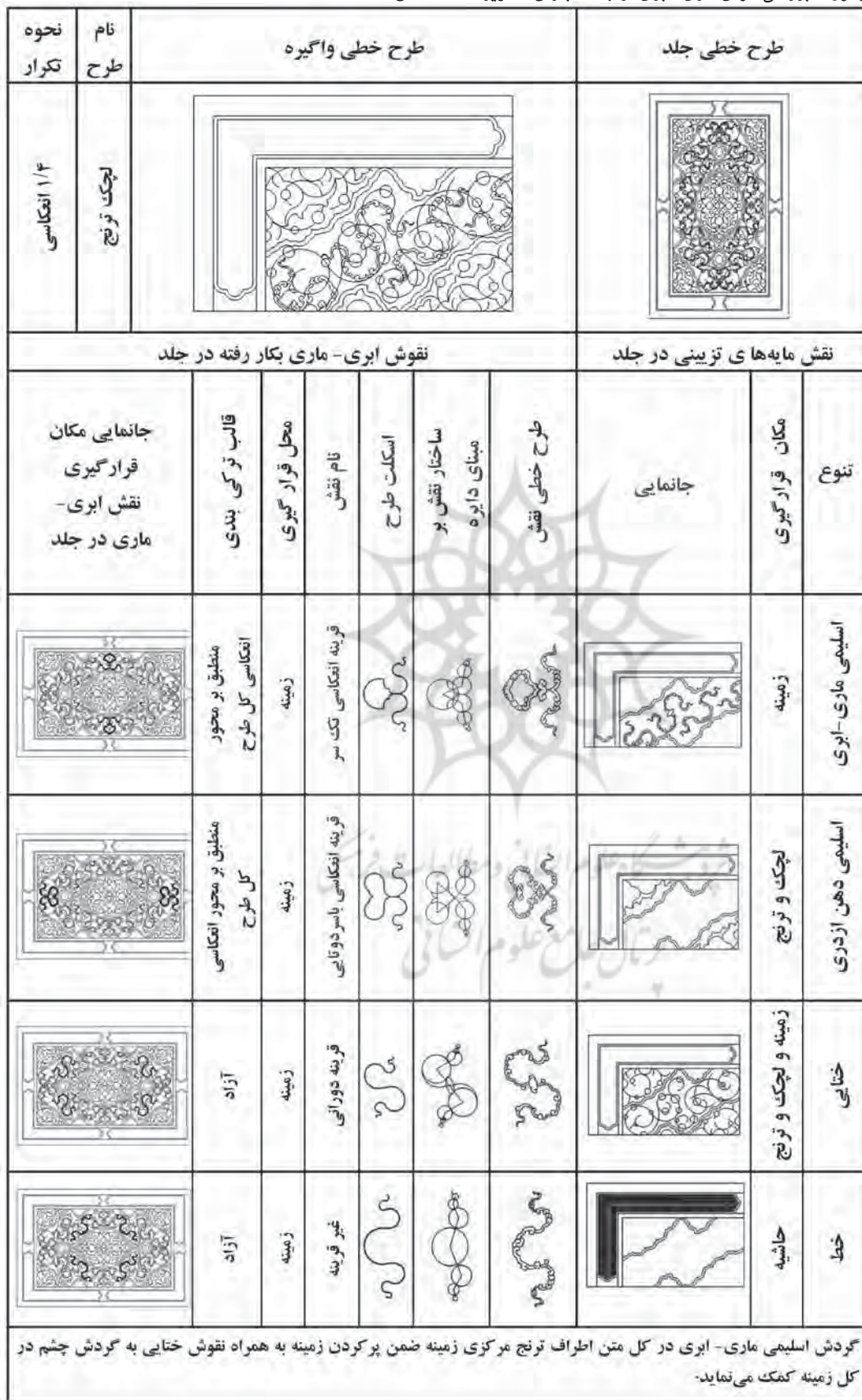
جدول ۷. بررسی نقوش ماری- ابری در جلد کتابقرآن (تصویره)