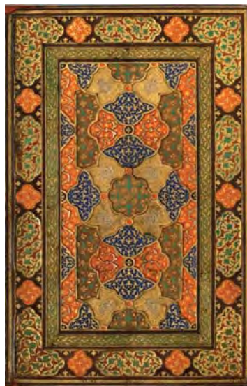
تصویر ۳. منطق الطیر (زبان پرندگان)، نویسنده: فرید الدین عطار، خط: سلطان علی مشهدی، حدود ۱۱۴۲-۱۲۲۰ هـ.ق، ابعاد: (۲۲.۷×۲۱.۱) CM، مأخذ: همان.

در هیچ یک از منابع شرح کامل و دسته‌بندی قاطعی برای نقوش ماری ابری به دست نیامد و هر مؤلفی بنا بر ظن خود از یکی از این دو نام بهره گرفته است حال آنکه نگارندگان با بررسی این نقوش و مصاحبه‌های به عمل آمده با اساتید طراحی، در مجموع به این نتیجه دست یافته است که این نقوش به فراخور حالت خود که مشابه حرکات بدن مار است به نقوش ماری شهرت یافته‌اند اما با توجه به گردش پیچک‌های ابر گونه که معروف به همان ابر چینی است با عنوان نقوش ابری هم شناخته می‌شوند به همین دلیل در طی این تحقیق نگارندگان از واژه اسلیمی ماری - ابری برای این نقوش استفاده کرده‌اند. کاربرد نقش