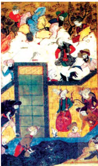
تصویر ۶. شهر بوتان و افسانه مم و زین، اندازه: ۱۶،۵۰×۱۹، مآخذ: همان: ۱۲۹