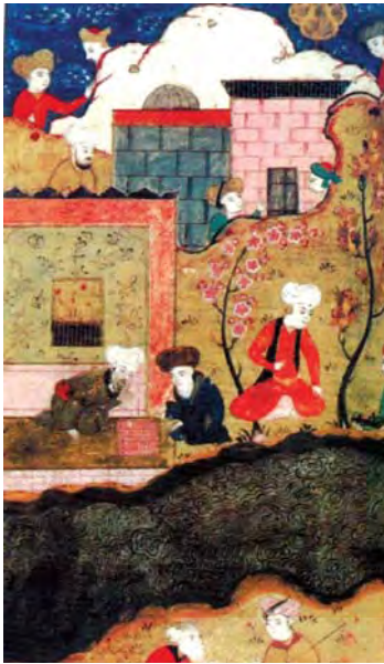
تصویر ۱۰. منظره‌ای در آگیل، اندازه: ۱۹×۱۶،۵۰