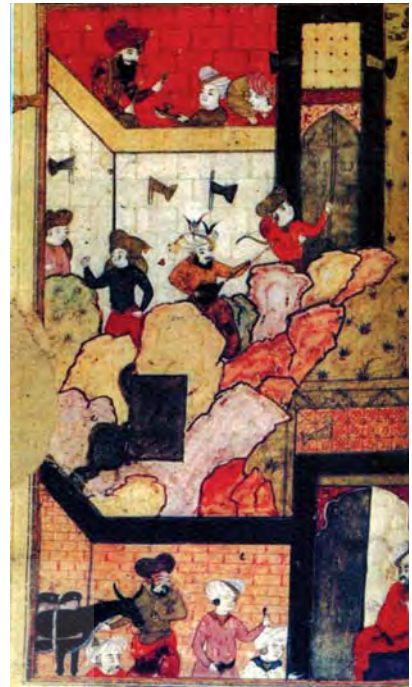
تصویر ۵. تسخیر قلعه دزی در هکاری، اندازه: ۱۶،۵۰×۱۹، مأخذ: همان: ۱۰۷

همان‌طور که اشاره شد نگاره‌های این نسخه باید توسط خود شرفخان یا به سرپرستی خود او تهیه شده باشند. با توجه به قراینی که ذکر شد و البته به طبع پرورده شدن شرفخان به عنوان نگارگر احتمالی یا حامی این نسخه در اصفهان، باید نگاره‌های این نسخه را صرف‌نظر از قدرت و برجستگی فنی آن در ذیل مکتب صفوی تعریف کرد. مکتبی در ادامه و محصول نهایی مکاتب بزرگی که در مکتب هرات به نهایت خود رسیدند. همان‌طور که اشاره شد این نگاره‌ها باید محصول کارگاه و کتابخانه کوچک امیری محلی (به احتمال زیاد خود شرفخان) باشد، کارگاه‌های کوچکی که می‌توان آثار آنها را این‌گونه وصف کرد: «ترکیب‌بندی آنها متنوع و