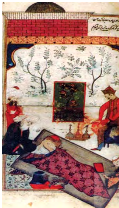
تصویر ۴: بیماری اعصاب و درمان با دعا، اندازه: ۱۶،۵۰×۱۹، مأخذ: همان: ۱۷۴

و دیگر امیران نسخه‌های متعددی از کتاب‌ها و نسخ خطی مصور را داشته و آنها را مطالعه کرده و از آنها بهره‌آفر برده است، کتبی مانند کتاب منافع الحیوان ابن بختیشوع، عبدالرقیب یوسف در کتاب نگاره‌های شرفنامه به نسخه منافع الحیوان ابن بختیشوع که اکنون در کتابخانه مورگان نیویورک محفوظ است اشاره کرده عنوان می‌کند که این نسخه متعلق به کتابخانه امیران روزکی بدلیس بوده و مهر شمس الدین ضیاءالدین روزکی و اسم او بر روی برگه‌ای از این نسخه است. به گفته یوسف، شرفخان - نقاش، این نسخه منافع الحیوان را در کتابخانه امیران بدلیس دیده و در نگاره ۱۷ بخش اول در کشیدن تخت سلطان عثمانی از تخت سلطان غازان در یکی از نگاره‌های منافع الحیوان تقلید کرده و همچنین کلاه امیر ارتقی در نگاره ۱۳ را از روی همین نگاره کشیده است (همان: ۸۰).