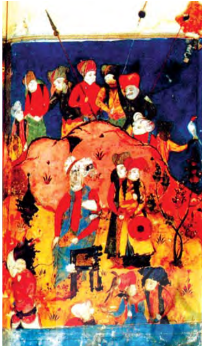
تصویر ۳. جوانی شرفخان بدلیسی، اندازه: ۱۶،۵۰×۱۹، مأخذ: همان: ۱۸۷

نگارگری چون شرفخان عجیب نمی‌نماید. نکته‌ای که باید به آن اشاره شود این است که شرفخان با برگشتن به بدلیس، احتمالاً به رسم و تبعیت از دربار صفوی، کتابخانه و کارگاه خود را بر پا کرده است. شرفخان در کتابخانه شاه نگارگری یاد گرفته، بعد از رفتن از ایران به فن‌آموزی خود ادامه داده و شاید اساتیدی از کتابخانه شاه را با خود همراه برده باشد (همان: ۲۶). هر چند نباید این نکته را از یاد برد که برپا کردن کارگاهی هنری از عهده هرکس ساخته نبود و داشتن کارگاه و کتابخانه منحصر به شاه و دربار او داشت. ابو پورتر در تحقیق خود درباره فنون کتاب‌آرایی به این نکته اشاره می‌کند: «کارگاه‌های نقاشی و تهیه نسخ خطی قسمتی از بخش‌های متعدد کارخانه یا بیوتات دستگاه سلطنتی را تشکیل می‌دهند» (پورتر، ۱۳۸۹: ۲۰۶)، اما روشن است که غیر از سفارش‌های شاهان نسخ مذهب دیگری نیز تولید می‌شد. بنابراین می‌شود نتیجه گرفت که کارگاه‌های دیگری علاوه بر کارگاه‌های سلطنتی وجود داشته است (همان: ۲۰۵). کارگاه شرفخان خارج از دربار صفوی و عثمانی همانند کارگاه‌های محلی موجود در شیراز و مشهد یکی از این کارگاه‌های محلی بوده است. کارگاهی کوچک و در حد یک امیر منطقه که همچون دیگر کارگاه‌های محلی و نه در حد آنها متناسب و وسیع و توانایی مالی و هنری خود آثاری تولید می‌کرد. این امر کارگاه‌های محلی مساله‌ای دارای پیشینه است. «پای‌پای آثار نقاشان بزرگ کتابخانه‌های سلطنتی، به سفارش هنرپروان