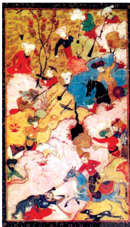
تصویر ۱. صحنه شکار در هکاری، اندازه: ۱۶،۵۰×۱۹ مآخذ: یوسف، ۲۰۰۵: ۱۰۲

روش انجام این پژوهش تاریخی-توصیفی و تحلیلی است و در این راستا ابتدا به معرفی نسخه و مشخصات ظاهری آن همچون جلد، سرلوحه، حاشیه، خط نسخه و تعداد نگاره‌ها پرداخته شده است و سپس به تجزیه و تحلیل سبکی و