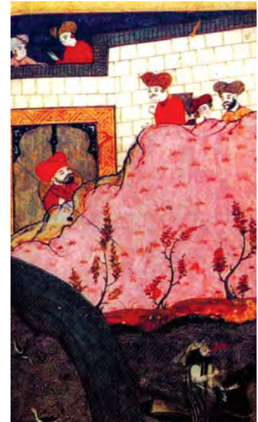
تصویر ۸. قلعه حسن کیف، اندازه: ۱۹×۱۶،۵۰، مأخذ: همان: ۱۴۱

نگاره با موضوع صفحه‌ای از شرفنامه که در آن قرار داده شده همخوانی دارد.