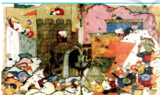
تصویر ۷. محاصره قلعه بدلیس از سوی آق‌قویونلوها، اندازه: ۱۶،۵۰×۱۹، مآخذ: همان: ۱۷۹

تکنیکی که نشانه‌های آن را باید تا نگاره‌های جلال‌ریان و تبریز قرن ۵۸۰ ق. دنبال کرد. «کشیده شدن بخشی از تصاویر به خارج از کادر ابداع جالبی است که در کلیله و دمنه مصور شده توسط احمد موسی / قرن ۱۴ م، قابل توجه‌ترین بروز آن را می‌بینیم» (گری، ۱۳۸۵: ۳۹؛ پاکبان، ۱۳۸۷: ۶۴).