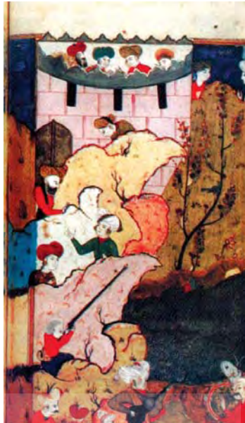
تصویر ۹. قلعه آگیل در دیاربکر، اندازه: ۱۹×۱۶،۵۰، مأخذ: همان: ۱۴۸