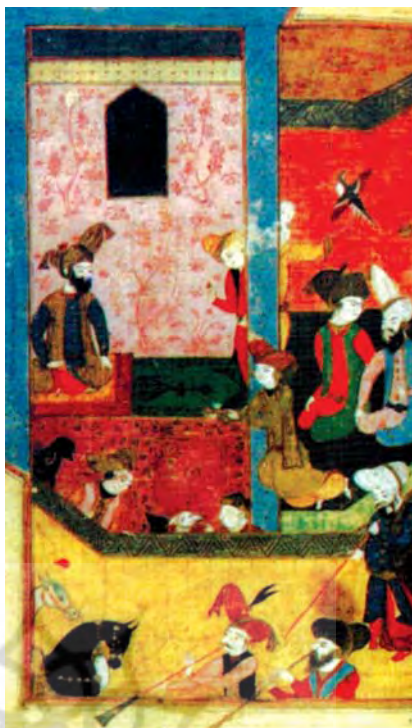
تصویر ۲. درونخانه امیر بوتان، اندازه: ۱۶،۵۰×۱۹

در مجموع باید گفت که تعداد نسخه‌های مشهور که تاکنون از شرفنامه به دست آمده‌اند و در کاتالوگ گنجینه نسخ خطی جهان ثبت شده‌اند، ۲۲ نسخه است (قاسیلیقا، همان: ۲۹۰). اینک ۹ نسخه خطی شرفنامه (۶ نسخه فارسی و ۳ نسخه