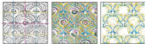
تصویر ۱- بررسی رنگ و ترکیب‌بندی قرینه در نمونه کاشی موجود در محوطه باستانی کاخ گلستان.

جدیدی نیز استفاده می‌شده است ( Fehervari, 2000: 232). این شیوه و ویژگی‌های آن، بر روی کاشی‌های هفت‌رنگ محوطه باستانی کاخ گلستان نیز تکرار شده است. این کاشی‌ها با رنگ‌های متنوع نقاشی شده‌اند و در آن‌ها، از رنگ‌های زرد و آبی لاجوردی بیش از دیگر رنگ‌ها بهره گرفته شده است. در نوع چیدمان و ترکیب بندی نیز، کاشی‌ها و نقش‌ها بیش‌تر به صورت قرینه هستند که این مورد، نوعی نظم و ریتم یک‌نواخت در فضا ایجاد نموده است. در تصویر ۱، این موضوع بررسی شده است. این کاشی‌ها ویژگی‌های فرهنگی ایران را در قالب تصاویر متنوع با رنگ‌های درخشان به نمایش گذاشته است.