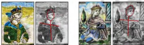
تصویر ۳- آنالیز ترکیب‌بندی و جهت نگاه با تاثیر از عکاسی، در نمونه نقش‌های انسانی در کاشی‌های محوطه باستانی کاخ گلستان.

- نقش انسانی مرد: در تصویر مرد، تنوع بیش‌تری هم از لحاظ شیوه ترسیم و هم از لحاظ موضوعی دیده می‌شود. مرد به صورت شخصیت‌های سیاسی، ملی، مذهبی، سربازان جنگجو یا محافظ وجود دارد. گاه تصویر انسانی مرد به صورت انفرادی در قاب قرار می‌گیرد و گاه تصویر نقاشی شده او را در تابلوهای داستانی محوطه می‌توان مشاهده نمود. تک فریم‌های موجود بر روی کاشی‌های لعابدار و برجسته محوطه باستانی کاخ گلستان، تصاویری از شخصیت‌های ملی، مذهبی را به نمایش می‌گذارند. این پیکره‌ها اغلب به صورت برجسته هستند و با استفاده از هاشور و دورگیری‌های مشکی رنگ ترسیم شده‌اند و رنگ‌های روشن، آن‌ها را پوشش داده‌اند. این شیوه، الهام گرفته از تصاویر چاپ سنگی این دوره می‌باشد. پیکره‌ها به صورت نیم‌رخ یا سه‌رخ ترسیم شده‌اند و نگاه آن‌ها به خارج از کادر هدایت می‌شود؛ این نوع ترکیب‌بندی و شبیه‌سازی از رواج عکاسی در این دوره، ریشه گرفته است. تصویر ۳، این نوع ترکیب‌بندی را مشخص می‌نماید.