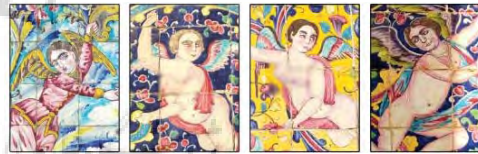
تصویر ۴- نقش اساطیری فرشته در کاشی‌های محوطه باستانی کاخ گلستان.

فرشتگان در برخی از تصاویر نقاشی شده روی کاشی‌ها و استفاده از سایه روشن و حجم نمایی در پوشش فرشتگان و اندام آن‌ها، تاکید محکمی بر نفوذ شیوه نقاشی اروپایی در هنر نقاشی قاجار است. علت این تاثیرپذیری از غرب، در پی رشد ارتباطات فرهنگی میان جامعه ایران و اروپا در دوره قاجار بوده است. مشابه این تصاویر را می‌توان در نقاشی دیواری‌های دوران رنسانس در اروپا نیز مشاهده نمود. «این فرشتگان یادآور (کوپید) کودک- خدای عشق یونانیان باستان می‌باشند؛ بنابراین، در دوره قاجار هم مانند رنسانس، فرشته‌ها از جایگاه آسمانی خود به زمین نزول کرده‌اند» (صفرزاده، ۱۳۹۳: ۶۴). فرشتگان به صورت تفکیک شده و در فریم‌های جداگانه ترسیم شده‌اند و در کنار این نقش، پیکره‌های انسانی دیگری دیده نمی‌شود. این طور به نظر می‌رسد که، تلفیق و همراهی فرشتگان با دیگر شخصیت‌های انسانی، از اهمیت و ارزش آن‌ها می‌کاسته است؛ بنابراین، ترسیم جداگانه این شخصیت‌ها، در هر قاب و قرار دادن فضاهای مجزا برای آن‌ها، تاکید بر ارزش و اهمیت آن‌ها است. در مقابل نقش زن فرشته، نقش انسانی مرد قرار دارد، که از دیگر نقش‌های پرکاربرد انسانی در کاشی‌های محوطه باستانی کاخ گلستان می‌باشد و بسیار متمایز از نقش فرشته، ترسیم شده است. در بخش بعدی، ویژگی نقش انسانی مرد بررسی شده است.