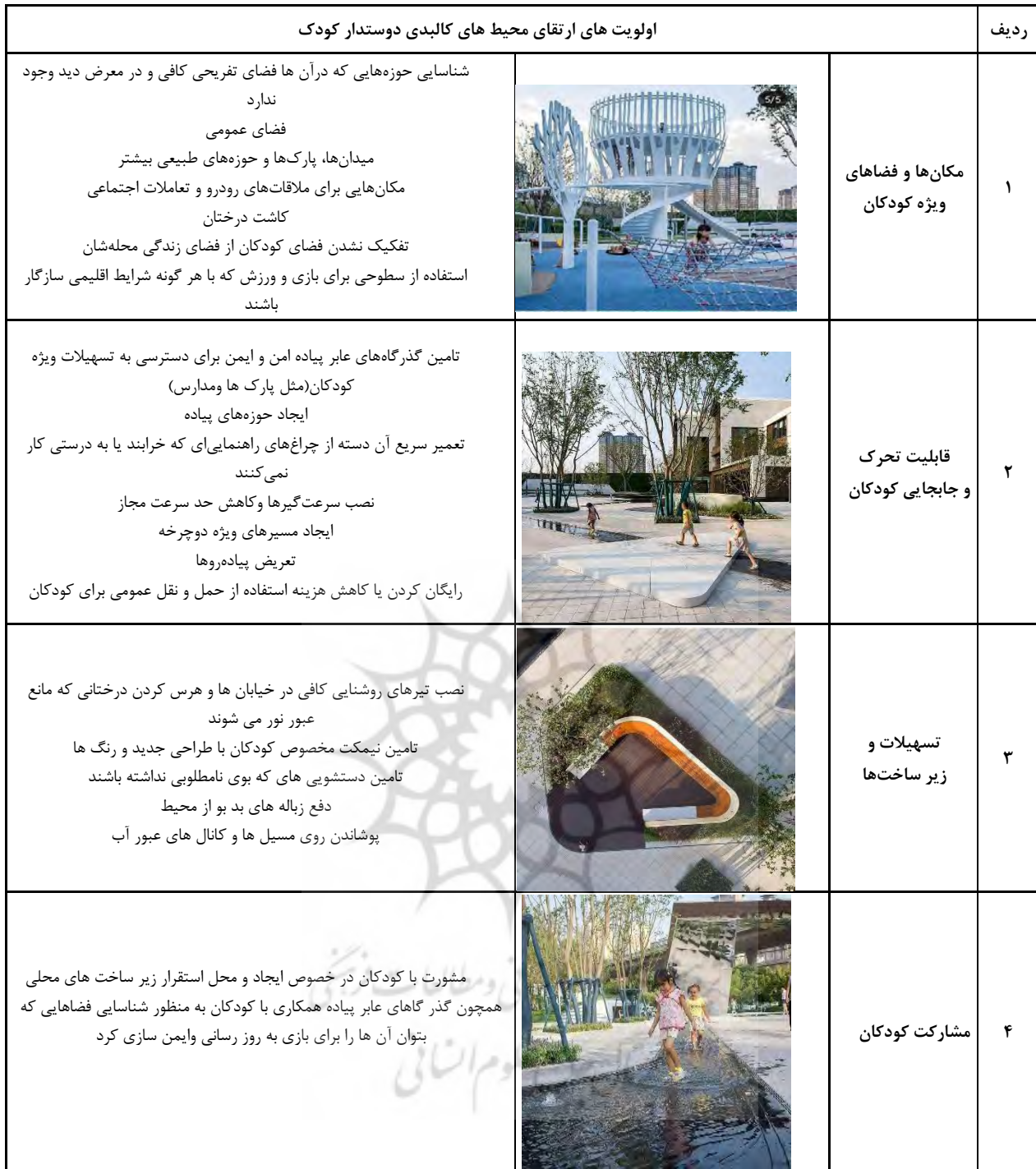
جدول ۵. اولویت‌های مد نظر برای ارتقای محیط‌های کالبدی دوست‌دار کودک

ماخذ: (نگارنده گان) به نقل از (بهروز فر و رازوجیان ، ۱۳۸۰، ۹۳؛ بار تلت ۲۰۰۶)