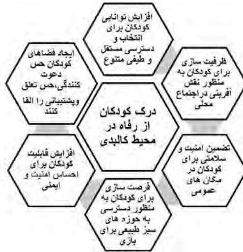
نمودار ۲. گزاره های منبعث از درک کودکان از رفاه در محیط کالبدی - ماخذ: (کمیسیون کودکان ۲۰۰۷)