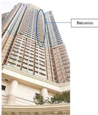
تصویر ۲: یک برج مسکونی که بالکن‌ها فقط در بعضی طبقات بالایی ساخته شده‌اند (Chan, 2015)

با این حال، ساخت بالکن برای آپارتمان‌های مسکونی واقع در طبقه پایین ساختمان، به دلیل سطح بالای سر و صدا و کیفیت پایین تهویه هوا مخصوصاً هنگامی که ساختمان مسکونی در یک منطقه شلوغ ترافیکی واقع شده است توصیه نمی‌گردد. یک مثال در تصویر ۲ ارائه شده است، عکسی از یک ساختمان مسکونی با بالکن‌های در کنار اتاق‌های نشیمن برخی از آپارتمان‌هایی که در طبقات بالای آن ساخته شده‌اند را نشان می‌دهد. علاوه بر این، امنیت یک نگرانی عمده دیگر برای بالکن آپارتمان‌های مسکونی در طبقات پایین تر است (Chan, 2015).