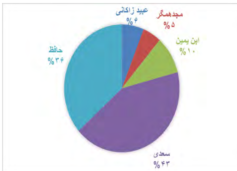
نمودار ۱: درصد تکرار و تداعی در انتقادهای شاعران