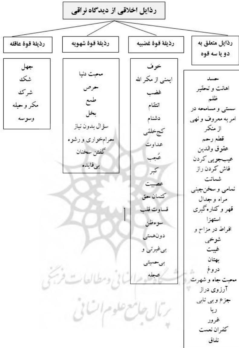
جدول ۱. ردایب اخلاقی از دیدگاه نراقی (نراقی، ۱۳۸۸)