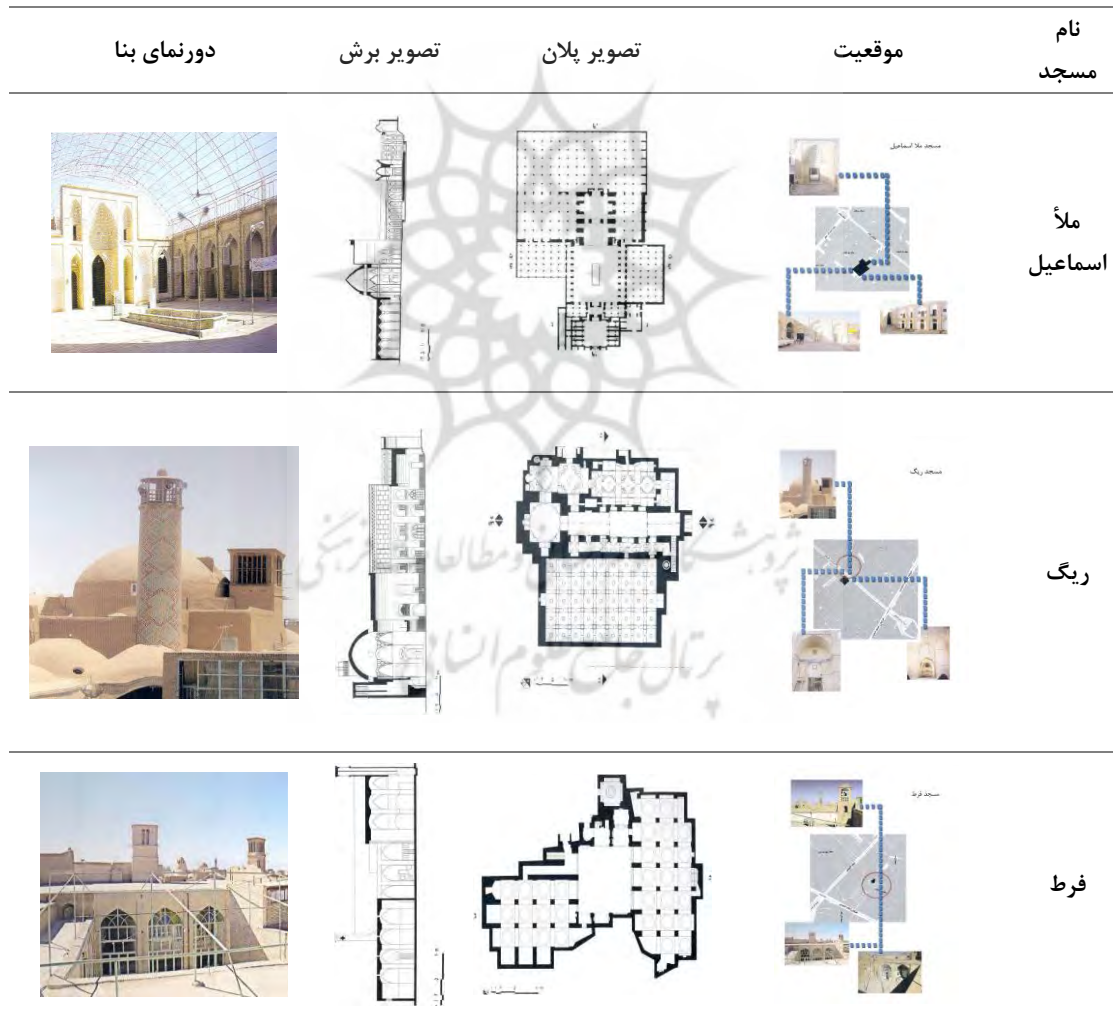
جدول شماره 1: بررسی نمونه‌های مورد بررسی پژوهش.

در جدول (شماره 1) به ارائه نمونه‌های موردی مساجد مورد مطالعه این پژوهش و در جدول (شماره 2) به فضاهای اختصاص یافته به این مساجد پرداخته شده است: