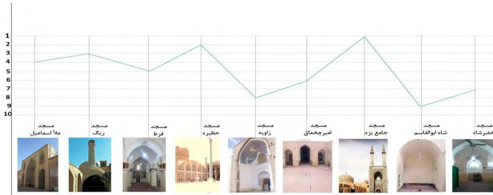
تصویر شماره 1: رتبه‌بندی نهایی مساجد بر اساس شاخص ویکور