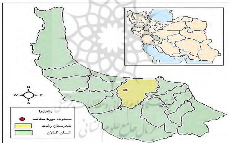
شکل ۱. نقشه موقعیت محدوده مورد مطالعه در تقسیمات سیاسی کشور و استان

محدوده مورد مطالعه شهر رشت از توابع استان گیلان در شمال ایران است که در ۴۹ درجه و ۳۶ دقیقه طول شرقی و ۳۷ درجه و ۱۶ دقیقه عرض شمالی واقع شده است. براساس سرشماری رسمی سال ۱۳۹۰، جمعیت این شهر ۹۵۱۶۳۹ نفر است و ۲۰۴۰۰۵۴ خانوار در آن ساکن هستند. محدوده استحقاقی براساس طرح جامع این شهر در سال ۱۳۸۶، ۱۶۰۱۸۸ هکتار است (مهندسان مشاور طرح کاوش، ۱۳۸۶: ۹) (شکل ۱).