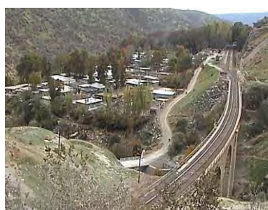
عکس ۱. نمایی از دید و منظر روستای ایستگاه بیشه