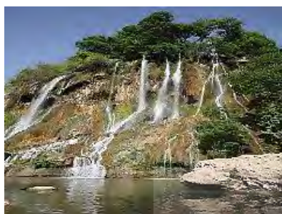
عکس ۲. نمایی از آبشار بیشه

۹. بازارچه محلی یکی از مراکز دیدنی و جالب روستاست که در آن انواع تولیدات روستا از قبیل صنایع دستی، لبنیات و محصولات باغی به فروش می‌رسد. انواع صنایع دستی، هنر، پوشش محلی، انواع غذاها، موسیقی، آداب و رسوم و جشن‌های محلی روستا را می‌توان از سایر جاذبه‌های روستا به‌شمار آورد. روستای ایستگاه بیشه، به دلیل قرار داشتن در مسیر راه‌آهن سراسری تهران-خوزستان و دسترسی آسان و سایر موارد گفته‌شده، موقعیت مطلوبی برای جذب گردشگر دارد. در این بین، یکی از مهم‌ترین مناطقی که از نظر تفریحی شباهت بسیاری با روستای اکوتوریستی ایستگاه بیشه، و در رقابت با آن قرار دارد روستای گریت در مجاورت ایستگاه بیشه است که به دلیل داشتن آبشار بسیار زیبای گریت، یکی از مناطق تفریحی مهم در استان لرستان محسوب می‌شود.