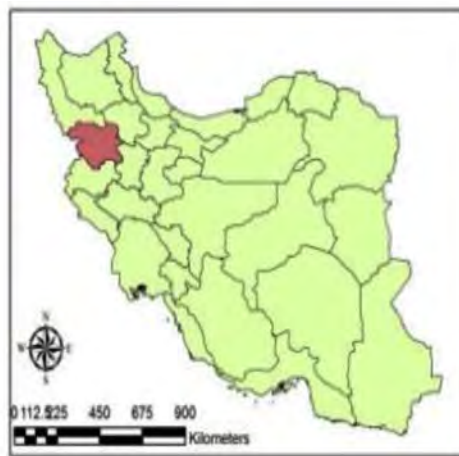
نگاره ۱: نقشه منطقه مورد مطالعه