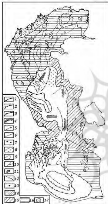
شکل ۱ (بژوهشگاه ملی اقیانوس شناسی و علوم جوی)

وضعیت زمین شناسی و زمین ریخت شناسی برخوردار است، سخن به گزافه نگفته ایم. این در حالی است که تنها نقشه های زمین ریخت شناسی موجود در مراکز علمی و مطالعاتی فارسی زبان مربوط به دهه های ۱۹۸۰ است که توسط شوروی رسم شده (شکل ۱) و نمی توان از لحاظ سیاسی و فنی صحت نقشه های رسم شده توسط شوروی را مورد استناد قرار داد. به خصوص آنکه با سایر نقشه های غیر رسمی موجود نیز تفاوت های فاحشی دارد (شکل ۲).