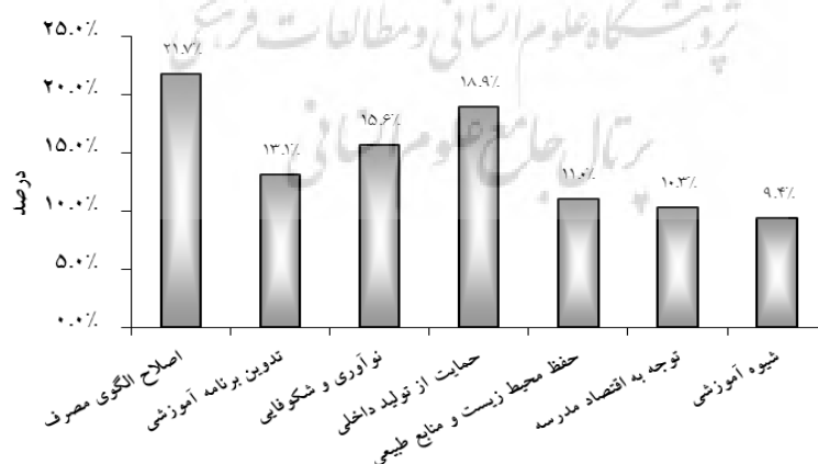
شکل ۱- درصد فراوانی مقوله‌های شناسایی شده

یافته‌های پژوهش با استفاده از تحلیل هم‌زمان و همچنین، فرایند کدگذاری، هنگام و پس از انجام مصاحبه‌ها به دست آمد. در ادامه، نتایج کدگذاری‌ها به تفکیک ارائه می‌شود. نتایج جدول شماره یک نشان می‌دهد که ۵۴ نشان می‌توانند در پیاده‌سازی اقتصاد مقاومتی در ورزش مدارس آموزش و پرورش ایران مؤثر باشند. سپس، این نشان‌ها در ۱۷ مفهوم طبقه بندی شدند. در نهایت، مفاهیم در قالب هفت مقوله طبقه بندی شدند که با توجه به مصاحبه‌های انجام شده، مقوله اصلاح الگوی مصرف با ۲۱/۷ درصد، بیشترین درصد فراوانی و مقوله شیوه آموزشی با ۹/۴ درصد، کمترین درصد فراوانی را به دست آوردند (شکل شماره یک).