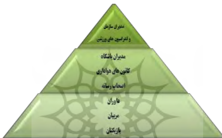
شکل ۳- هرم پیشنهادی برگرفته از مدل مفهومی و یافته‌های پژوهش

مفهومی انجام شود که در سطح خرد، بازیکنان، مربیان و داوران می‌توانند جامعه هدف آموزش درزمینه آشنایی با قوانین و شناساندن خطوط قرمز باشند. در سطوح میانی نیز مدیران باشگاه‌ها، کانون‌های هواداری و کارکنان می‌توانند جامعه هدف آموزش قرار گیرند و در سطح کلان نیز مدیران سازمان‌های ورزشی و فدراسیون می‌توانند جامعه هدف آموزش قرار گیرند که در هرم آموزش کاهش فساد در شکل مشاره سه مشاهده می‌شود: