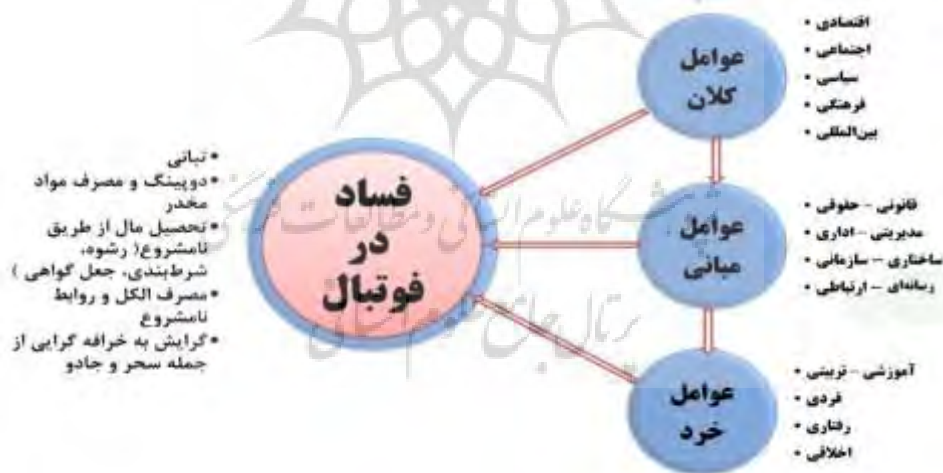
شکل ۱- مدل مفهومی مؤلفه های مؤثر بر بروز فساد در فوتبال ایران

میانی و کلان را در نظر گرفته و با توجه به همه مطالعات مربوط به فسادهای داخلی و خارجی و با بررسی اسناد، مدارک و سایت مرتبط با فوتبال سعی شد پژوهشگر چهارچوب جامعی از پدیده فساد ارائه دهد که برای ادامه مطالعاتی از این دست به پژوهشگران کمک شود. از آنجایی که از فوتبال به عنوان موتور محرک ورزش یاد می شود، توجه به مقوله فساد و کج روی در این رشته ضروری به نظر می رسد (نجفی کلوری، گودرزی، فراهانی و بیدهندی اسماعیلی، ۱۳۹۱). ابراهیم، کومی و ییواه ۱ (۲۰۱۵) مبارزه با فساد را از طریق شناسایی موارد فسادزا مقدم بر تدوین راهبردهای هر سازمان می دانند؛ بنابراین، با توجه به اهمیت مبارزه با فساد و در راستای سالم سازی محیط رقابتی، برقراری عدالت و تحقق آرمان های متعالی فوتبال در هر کشوری، این پژوهش به بررسی مؤلفه های مؤثر در بروز فساد در فوتبال ایران پرداخت. با توجه به نقاط قوت و ضعف در پژوهش های انجام شده، روش پژوهش، جامعه و پروتکل متناسب با وضعیت باشگاه های لیگ حرفه ای فوتبال، برای شناسایی مؤلفه های فساد در همه سطوح کلان، میانی و خرد شاخص های فسادآور در قالب یک کار سیستمی بررسی شده اند. افزون بر این، با توجه به اسناد و مدارک، پژوهش های داخلی و خارجی در مورد فساد در ورزش و از جمله فساد در فوتبال و همچنین، با توجه به مصاحبه نیمه ساختاریافته با صاحب نفعان فوتبال و نخبگان در مدیریت ورزشی و صاحب نفعان در حوزه فوتبال، الگو و مدل مفهومی پدیده فساد در فوتبال ایران طراحی شد.