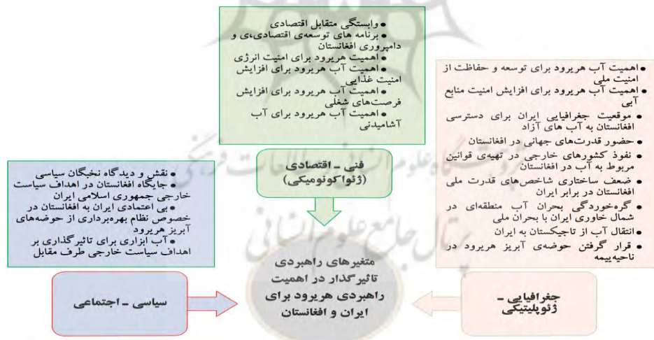
شکل ۱- شاخص‌های شناسایی شده با استفاده از روش دلفی

متغیرها و شاخص‌های به دست آمده از مطالعات کتابخانه‌ای در قالب پرسشنامه تنظیم و برای اجرای روش دلفی به جامعه‌ی آماری ارسال شد. بعد از امتیازدهی به شاخص‌ها با توجه به میانگین نظر متخصصان، در نهایت شاخص‌های تأثیرگذار در اهمیت آب هریرود برای ایران و افغانستان مطابق شکل ۱ انتخاب شدند.