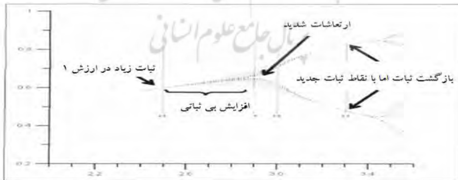
شکل ۲: فشارهای سیستمی و شاخه‌ای شدن

الگوی گذار بر اساس یکی از مهم‌ترین ویژگی‌های سیستم‌های پیچیده و آشوبی، یعنی شاخه‌ای شدن، قابل باز تعریف است. بر اساس این ویژگی، سیستم‌های یاد شده، دورانی از ثبات را طی می‌کنند که انرژی‌های گوناگونی وارد آنها خواهد شد. انباشت انرژی و فشارهای ناشی از آن، تا آستانه خاصی تحمل می‌شود اما در صورتی که سیستم در آستانه رفتاری خود قرار گرفته باشد، کوچک‌ترین ورودی انرژی، می‌تواند پیامدهای زیادی را در پی داشته باشد. در این مرحله، یکی از ویژگی‌های سیستم، شاخه‌ای شدن نظم و انتقال فشارها به این شاخه‌ها است. سیستم پس از شاخه‌ای شدن، دوره نوینی از ثبات را طی خواهد کرد و مجدداً دوره شاخه‌ای شدن، تکرار خواهد شد. فیچر و وایت‌میر این موضوع را به صورت زیر نشان می‌دهند (Fichter, Pyle, & Whitmeyer, 2010: 76):