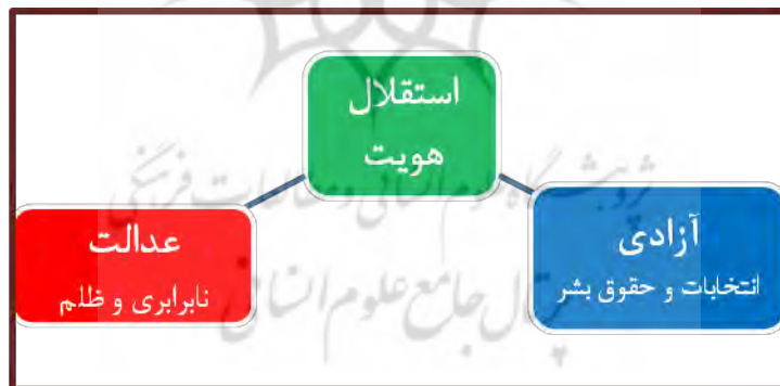
شکل ۳-۴ اندیشه‌های قانونی انقلاب اسلامی

تفاوت رهیافت‌ها که برگرفته از خاستگاه‌ها و روایت‌های گوناگون گروه‌های مبارز بود، نوع مواجهه گروه‌ها با هر یک از مفاهیم سه‌گانه را سامان می‌داد. در حاشیه قرار دادن آزادی و دموکراسی و برجسته‌سازی عدالت و استقلالی که معطوف به طبقات فرودست می‌شد، رهیافت گروه‌های چپ را در مبارزه شکل می‌داد. گروه‌های ملی‌گرا بیشتر از دو مفهوم آزادی و استقلال سخن می‌گفتند و عدالت را در ذیل این دو مفهوم قرار می‌دادند. به همین دلیل عدالت در گفتمان ملی‌گراها در حاشیه قرار داشت. نزد گروه‌های اسلامی هر سه مفهوم دارای وزن تقریباً مشابهی بودند و البته قیدی اسلامی برای هر سه مفهوم در این قلمروی گفتمانی - اسلام سیاسی - قرار داشت.