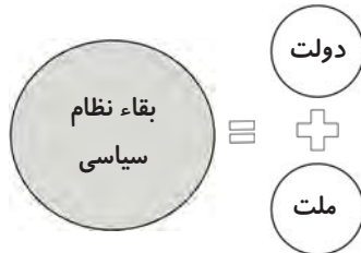
نمودار ۲: تأثیر عدم‌همکاری دولت و ملت در کاهش مقبولیت و مشروعیت