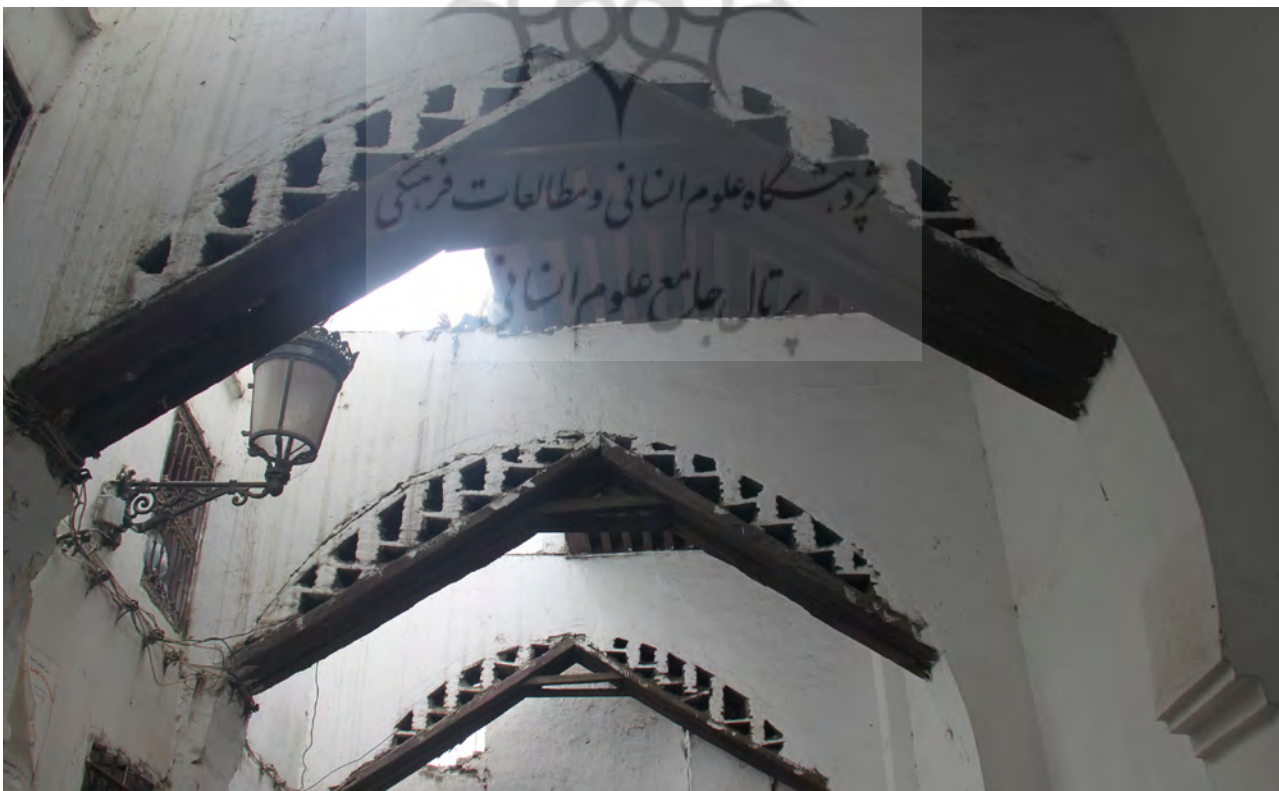
تصویر ۱-۴. نوع پوشش سقف در بازارها. مراکش. عکس: ساره جورمند، ۱۳۹۵.