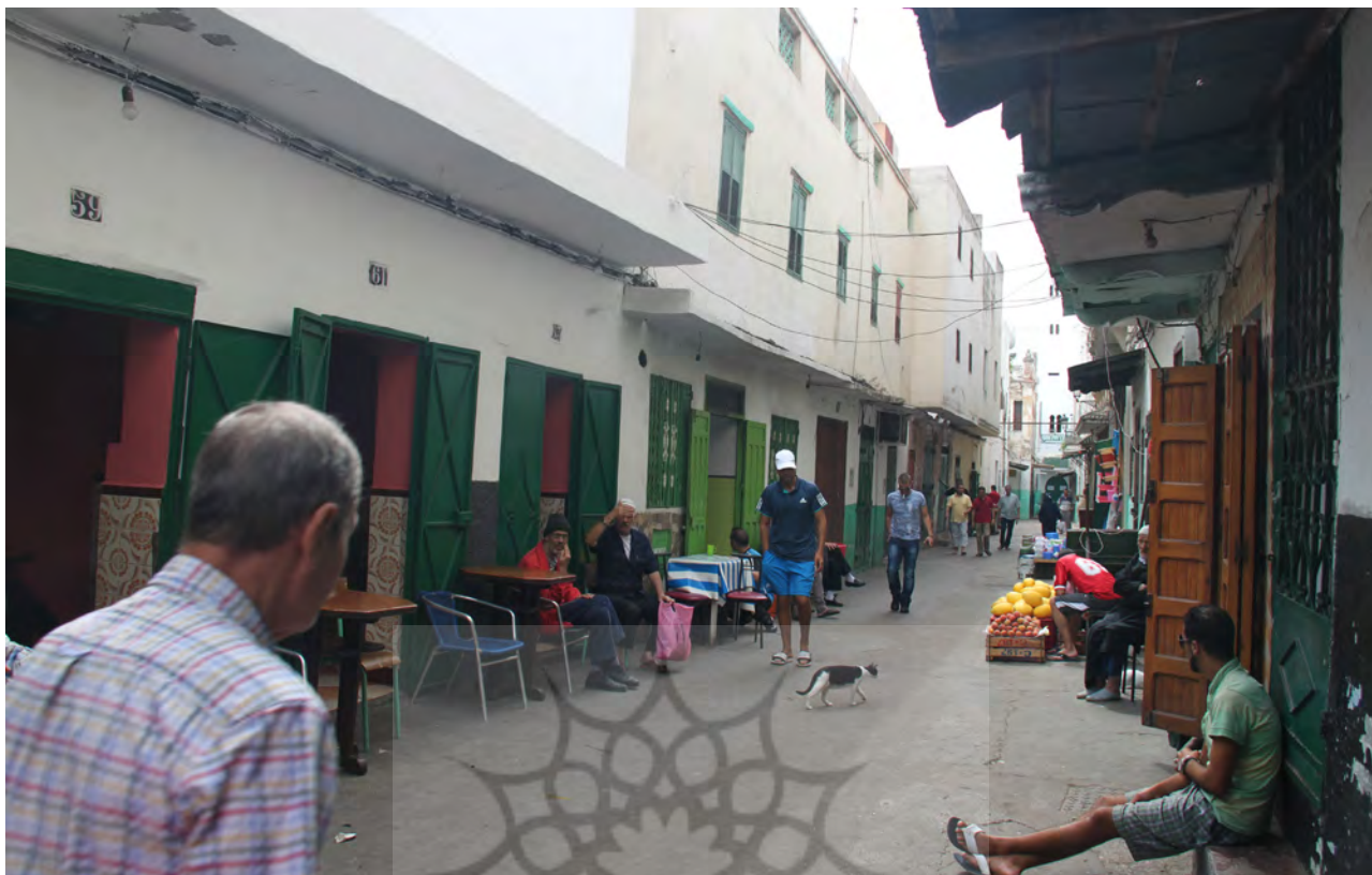
تصویر ۳. نمونه تنوع فضایی موجود در شهرهای تانژه و تطوان که در هر دو شهر یکی است ولی در تصویر یک شهر آمده است. تانژه و تطوان، عکس: ساره جورمند، ۱۳۹۵.