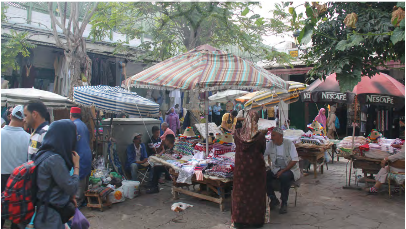
تصویر ۶. نسبت بازار با دیگر عملکردها. فاس، ۱۳۹۵.