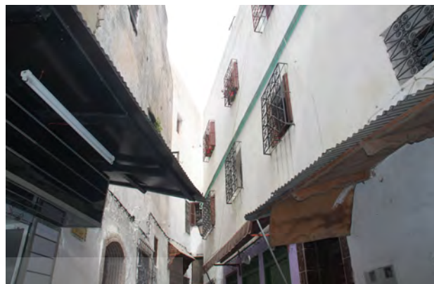
تصویر ۱- گذرهای باریک و پیچ در پیچ تطوان، عکس: ساره جورمند، ۱۳۹۵.