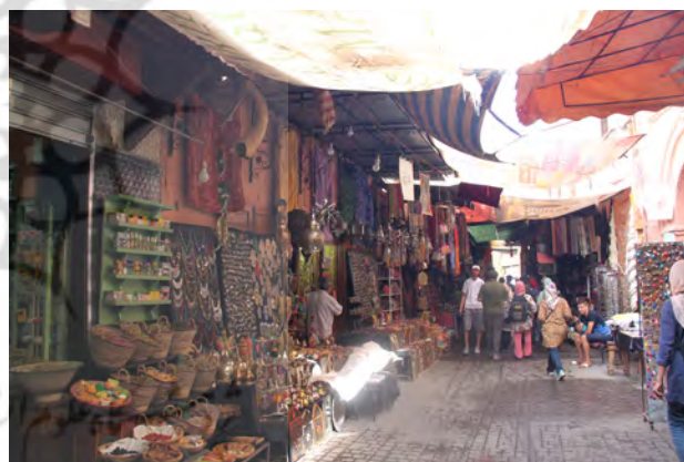
تصویر ۲- تنوع محصولات، مراکش، عکس: ساره جورمند، ۱۳۹۵. تصویر ۱- تنوع محصولات، مراکش، عکس: ساره جورمند، ۱۳۹۵.