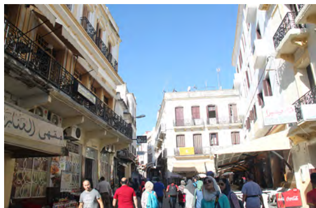
تصویر ۲- تنوع فضایی. تانزه، عکس: ساره جورمند، ۱۳۹۵.