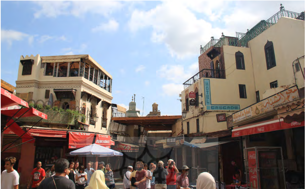
تصویر ۵. واشدگاه فضای انتهایی بازار، تطوان، عکس : ساره جورمند، ۱۳۹۵.