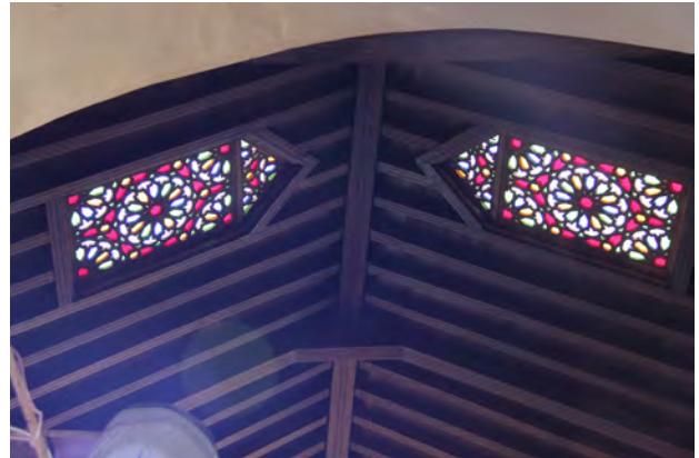
تصویر ۲-۴. تنوع پوشش سقف در بازارها. فاس، عکس: ساره جورمند، ۱۳۹۵.