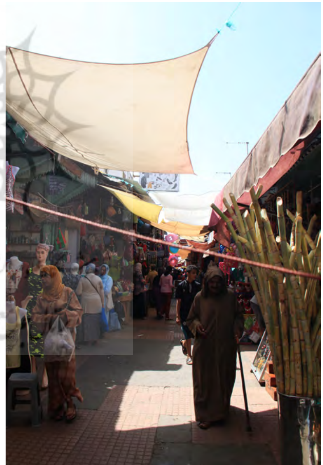
تصویر ۴-۴. تنوع پوشش سقف در بازارها. تطوان، عکس: ساره جورمند، ۱۳۹۵.

«کانتر» در تکمیل کار رالف و مونتگمری، مکان را شامل فعالیت، خصوصیات کالبدی و معانی محیط تعریف می‌کند. اغلب در تعاریف مکان بر اهمیت خصوصیات کالبدی اغراق می‌شود، در حالی که فعالیت‌ها و معانی اغلب تأثیر مهم‌تری در خلق حس مکان دارند (همان).