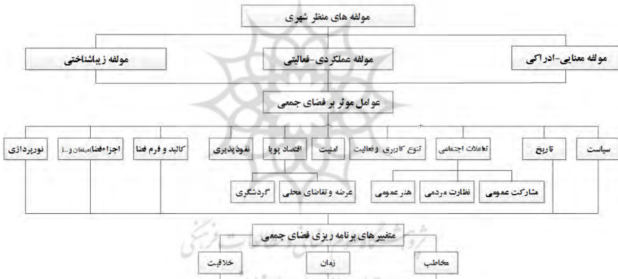
تصویر ۲. نمودار مفهومی تحقیق مطابق تصویر ۲.

روش AHP مطابق جدول شماره ۲ از نظر اهمیت در خلق فضای جمعی صورت گرفته است. ارزیابی انجام شده نشان می‌دهد به ترتیب اولویت مؤلفه عملکردی-فعالیتی، مؤلفه معنایی-ادراکی و مؤلفه زیبایی‌شناختی بر کیفیت فضای جمعی جماع‌الفا مؤثرند. پس از تحلیل مقایسه‌ای کیفی ذکر شده، تلفیق تحلیل نتایج به روش AHP در ارتباط با گزینه‌ها صورت پذیرفت. وزن‌دهی گزینه‌ها نیز با روش سلسله‌مراتبی انجام شده و بین هدف و این سه گزینه پیوند برقرار شده است. با شناخت تحلیلی سایت جماع‌الفا مشخص شد مخاطب بیش‌ترین تأثیر را بر برنامه‌ریزی و مدیریت فضای جمعی دارد