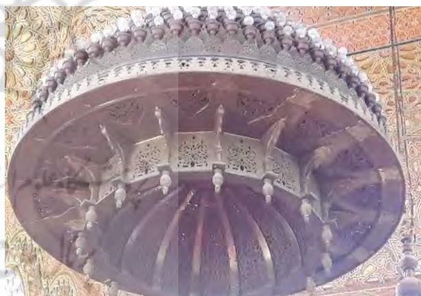
تصاویر ۹ و ۱۰. استفاده از نقش کنگره در صنایع دستی مراکش، عکس: دانش طاهرآبادی، ۱۳۹۵.

فرش کنگره ظاهر می‌شود و به منزله قاب عمل می‌کند. به طور کلی در تزئینات و معماری و صنایع دستی حاشیه عنصری جدایی‌ناپذیر از سطوح تزئینی است که بر فرش، ظرف و سطوح معماری جلوه گر شده است (تصاویر ۱۱ و ۱۲).