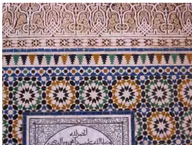
تصاویر ۵۰۶ استفاده از کنگره در کاشی کاری‌های مراکش، عکس : دانش طاهرآبادی، ۱۳۹۵.