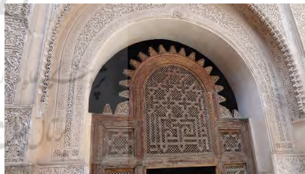
تصاویر ۸۰۷ استفاده از کنگره در کارهای چوبی، عکس : دانش طاهرآبادی، ۱۳۹۵.

اعم از پارچه، گلیم و فرش افزایش یافته و از تولیدات و صنایع دستی مهم مراکش به شمار می‌روند. در نقش‌های این منسوجات نیز کنگره به وفور دیده می‌شود که نقش آن مانند آنچه در تزیینات معماری به کار رفته تکرار شده است. کنگره‌ها در نقاط عطف تزیینات، سایر نقوش فرش در محل لبه‌های عوض شدن ریتم به صورت پرتکرار دیده می‌شوند انواع کنگره‌های ریز و درشت با توجه به دیگر نقوش هندسی بر سطح فرش ظاهر شده‌اند. گاه در حاشیه لچکی یا ترنج مرکزی