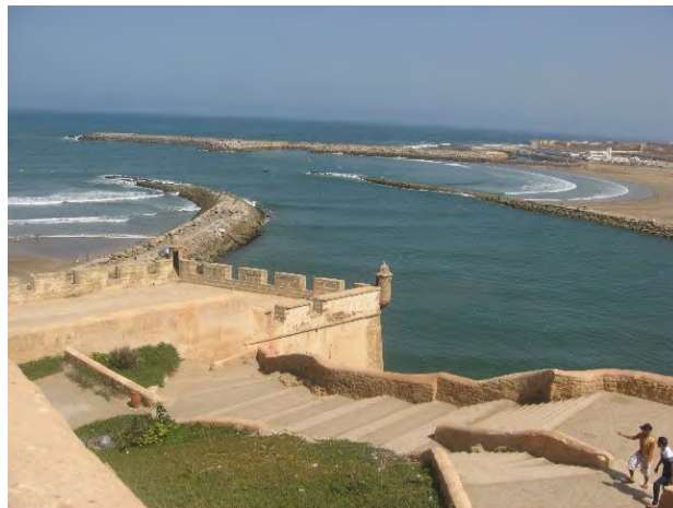
تصاویر ۱ و ۲. استفاده از کنگره در استحکامات دفاعی کشور مراکش (خاستگاه کنگره)، عکس: دانش طاهرآبادی، ۱۳۹۵.