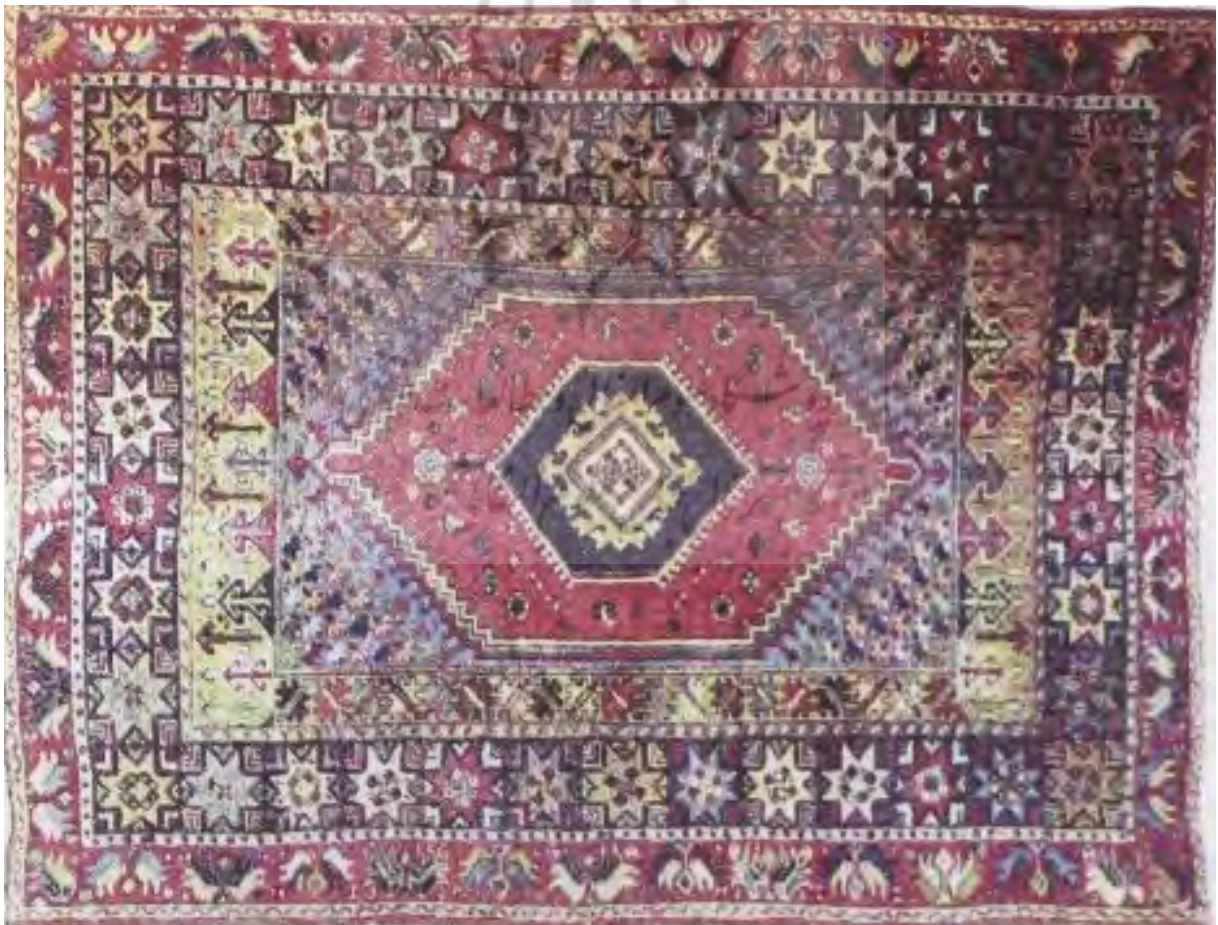
تصویر ۱۳. فرش عشایری اطلس وسطی، مأخذ: مجایی، ۱۳۸۸.