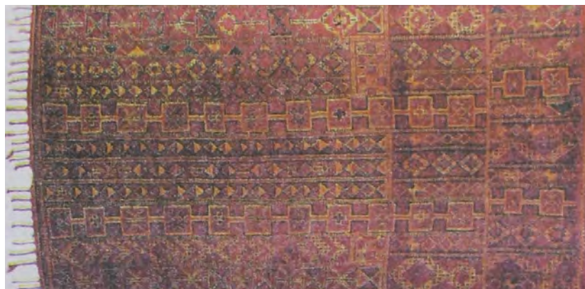
تصویر ۱۴. فرش زمور، مأخذ: مجابی، ۱۳۸۸.