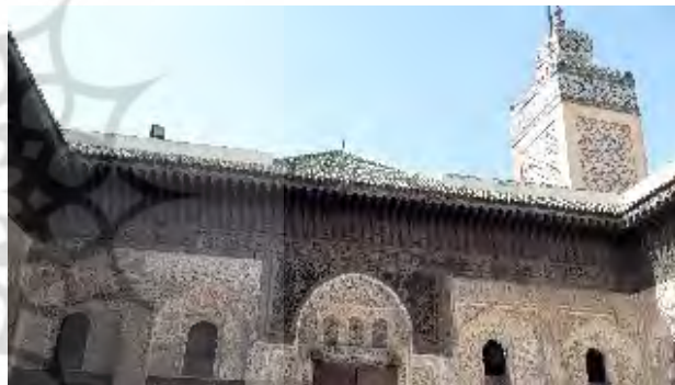
تصاویر ۳ و ۴. استفاده از کنگره در خط آسمان بناهای غیرنظامی (مساجد، مدرسه‌ها و مناره‌ها)، عکس: دانش طاهرآبادی، ۱۳۹۵.

توجه، حریم امن داخل مدینه‌ها را از دنیای آسیب پذیرتر آن جدا می‌کرده است.