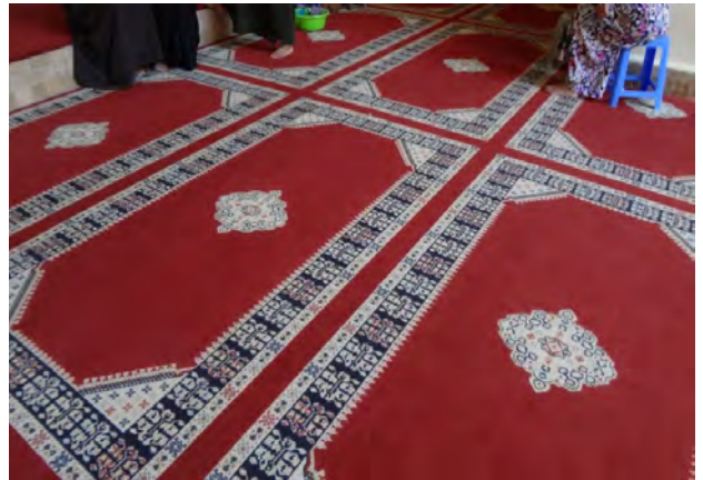
تصاویر ۱۱ و ۱۲. استفاده از کنگره در نقش‌های محصولات بافتنی مراکش، ۱۳۹۵.