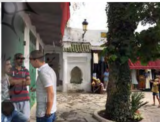
تصویر ۷. شکل‌گیری فضای مذهبی، اجتماعی و فرهنگی در کنار چشمه در مدینه شهرهای مراکش، تطوان، کشور مراکش، عکس: فاطمه‌السادات شجاعی، ۱۳۹۵.

تضاد، بیان ارتباط منطقی میان اجزا و عناصر مختلف یک ترکیب و یا یک اثر هنری است. بهره گرفتن از تضاد در آثار هنری باعث جلوه بیشتر معنی، گویاتر شدن حالت، قوی‌تر نشان دادن احساس و در نتیجه انتقال مفاهیم و پیام‌ها به شکلی مؤثرتر و عمیق‌تر