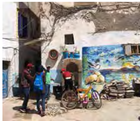
تصویر ۵. استفاده از رنگ آمیزی و اختلاف رنگ برای تمایز دیواره چشمه آبخوری با دیوار اطراف در مدینه شهرهای مراکش، شفشاون، فاس، الصویره. عکس: فاطمه‌السادات شجاعی، ۱۳۹۵.