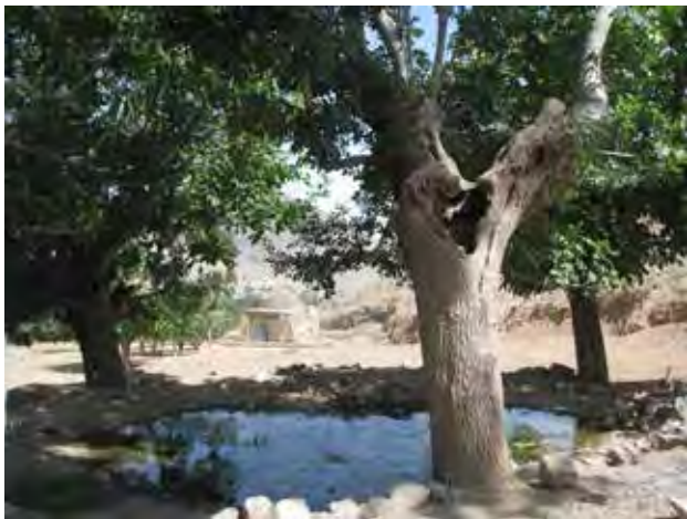
تصویر ۱. همجواری چشمه، درخت و چارتاقي، روستا، اصفهان. عکس: فاطمه‌السادات شجاعی، ۱۳۹۵.