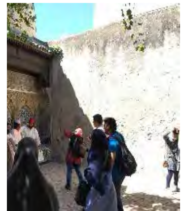
تصویر ۴. چشمه عنصر مشترک در همه نقاط عطف محلات در شهرهای مراکش، فاس، مکناس، طاتزه، عکس: فاطمه السادات شجاعی، ۱۳۹۵.