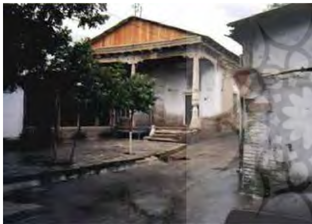
تصویر ۲. مرکز محله در آسیای میانه فضای شکل‌گیری روابط اجتماعی است، آسیای میانه، مأخذ: The Aga Khan Trust For Culture, ۱۹۹۷.