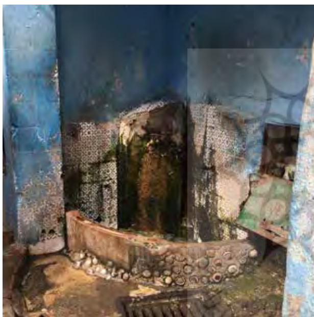
تصویر ۸. تمایز دیوار چشمه آبخوری با استفاده از عناصر طبیعی مثل سنگ رودخانه و صدف دریایی. طائزه، تطوان، تطوان، کشور مراکش. عکس: فاطمه‌السادات شجاعی، ۱۳۹۵.

است. تضاد را می‌توان از نظر اندازه، جهت، حالت، رنگ، تیرگی، روشنی و بافت شکل‌ها و یا از نظر فضای پر و فضای خالی، حجم مثبت و حجم منفی، فرورفتگی و برجستگی، شکل و زمینه مورد بررسی قرار داد.