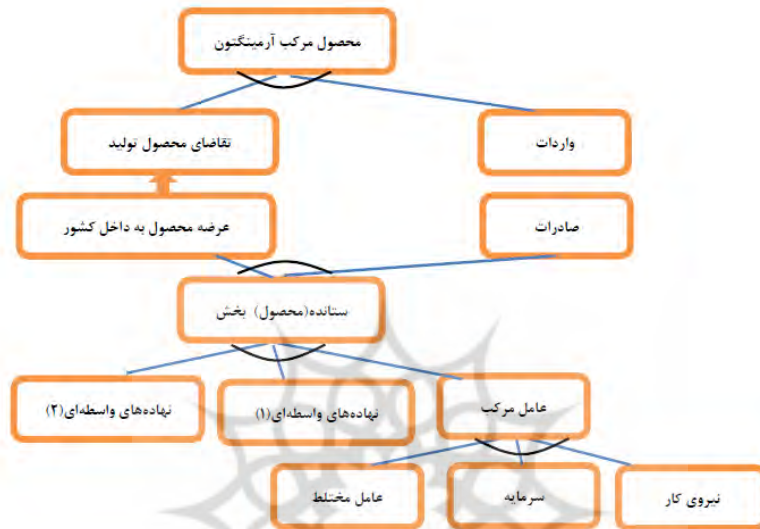
نمودار (۱): سطوح مختلف مدل تعادل عمومی

به این ترتیب چارچوب نظری مشخصی از اجرای مدل تعادل عمومی شکل خواهد گرفت که در نمودار (۱) نشان داده شده است. این مدل حالت تعدیل یافته مدل ارائه شده توسط (هوزوه و دیگران ۱ ، ۲۰۱۰) می باشد که برای یک اقتصاد باز کوچک و با هدف ایجاد امکان بررسی آثار اقتصادی سیاست‌های مالی طراحی شده بود. ۲