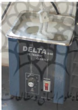
تصویر ۲۳- دستگاه اُلتراسونیک

از قطعات مختلف پاک‌سازی نماید. امواج اُلتراسونیک می‌توانند در آب منتشر شوند اما اگر از ماده شوینده مناسبی استفاده شود، عملکرد دستگاه بهبود می‌یابد. این امواج باعث رخداد پدیده کاویتاسیون ۲ می‌شوند. این پدیده حباب‌های بسیار ریزی ایجاد می‌کند که با برخورد به ضایعات و کثیفی‌ها، می‌توانند آن‌ها را به خوبی حتی در کورترین نقاط شیء، پاک نمایند. در حال حاضر شستشوی اُلتراسونیک یکی از پیشرفته‌ترین روش‌های شستشو است که در مدت کم قابل انجام است. از تمیزکننده‌های مافوق صوت برای تمیز کردن مواد مختلفی مانند جواهرآلات، لنزها، ساعت‌ها، ادوات دندانپزشکی و جراحی، قطعات خودرو، ادوات موسیقی، ادوات خالکوبی و لوازم الکترونیکی استفاده می‌شود. ۳