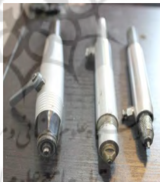
تصویر ۱۳- انواع سرهای فرز