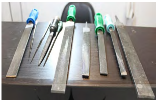
تصویر ۱۹- انواع سمباده

سمباده: از این ابزار برای صیقل دادن و از بین بردن ناصافی‌ها در ساخت انگشتر استفاده می‌شود.