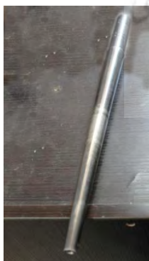
تصویر ۱۸- میل انگشتر

حلقه نمره، میل سائز و میل انگشتر: حلقه نمره برای اندازه‌گیری سائز انگشت و میله سائز برای اندازه‌گیری سائز انگشتر مورد استفاده قرار می‌گیرند. میله انگشتر فولادی نیز به‌منظور ثابت نگه‌داشتن انگشتر در حین جا انداختن نگین روی انگشتر استفاده می‌شود.