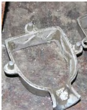
تصویر ۱۱- نیم درجه