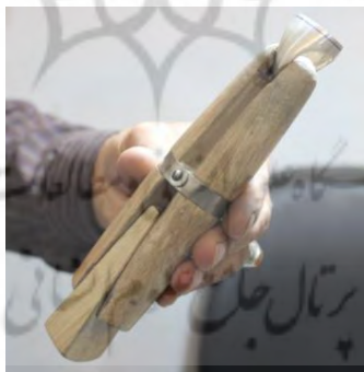
تصویر ۲۰- گیره پیچ

گیره: از گیره به منظور نگه‌داشتن انگشتر هنگام فرم دادن، سمباده کشیدن، جا انداختن نگین انگشتر و ... استفاده می‌شود.