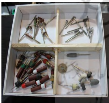
تصویر ۱۴- انواع سرهای فرز (انواع پوست‌ها، لاستیک‌ها، سمباده‌ها)

فرز: از دستگاه فرز و سرهای مختلف و متنوع آن برای شیار در آوردن، کنار تراشی، سمباده زدن و ... استفاده می‌شود. ۱