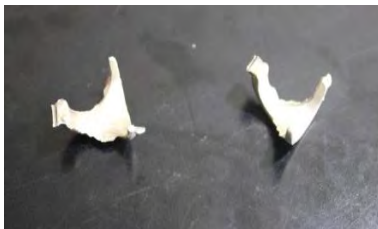
تصویر ۳۷- شکل اولیه دو بازویی انگشتر پس از ریخته‌گری

۲- تمیز کردن: پس از انجام ریخته‌گری و به دست آوردن شکل کلی و اولیه دو بازویی انگشتر، انگشترساز در این مرحله به کمک سوهان و سمباده به تمیز کردن و فرم دادن بازویی‌ها می‌پردازد (تصاویر ۳۸ و ۳۹ و ۴۰).