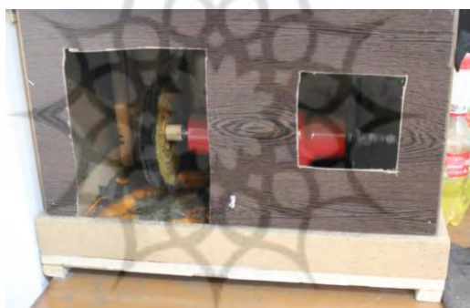
تصویر ۲۲- دینام پرداخت

دینام پرداخت: از این دستگاه برای صیقل دادن یا ایجاد پس‌زمینه‌های زبر روی سطح فلزات استفاده می‌شود. ۱