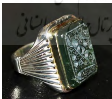
تصویر ۵۸- انگشتر تکمیل شده، پس از اتمام مراحل ساخت