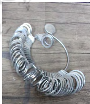
تصویر ۱۶- حلقه نمره