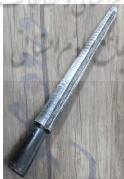
تصویر ۱۷- میل سائز