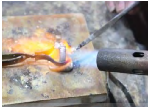
تصویر ۴۱- جوشکاری

۳- جوشکاری: در این مرحله دو بازویی انگشتر که به صورت مجزا ریخته‌گری شدند به یکدیگر جوش داده می‌شوند (تصویر ۴۱).