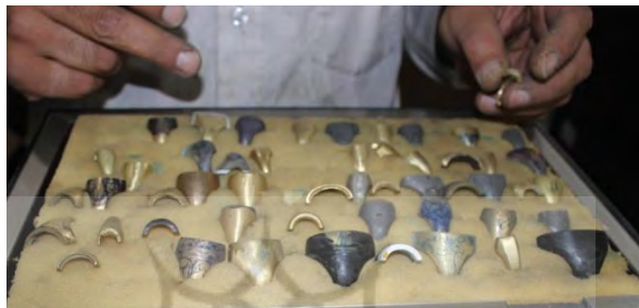
تصویر ۲۴- انواع الگوهای اولیه انگشتر

ریخته‌گری دارند. البته الگوها معمولاً ثابت هستند و از قبل ساخته شدند و در مواقعی که قرار باشد انگشتری با طرح جدید طراحی شود الگو اولیه آن را معمولاً با صابون بر اساس طرح موردنظر درست می‌کنند. الگوهای نهایی می‌تواند از جنس‌های مختلف باشد؛ البته در اکثر موارد به دلیل پایداری ابعاد و عمر طولانی فلزات از جنس فلز ساخته می‌شوند.