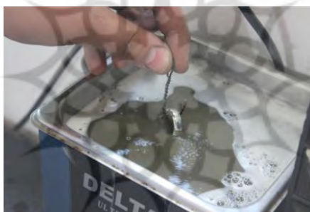
تصویر ۵۷- تمیز کردن انگشتر

۱۲- حمام الٹراسونیک: در نهایت از دستگاه الٹر برای تمیز کردن کثیفی و ضایعات اکسیدهای ناشی از پولیش زدن انگشتر استفاده می‌شود (تصویر ۵۷).