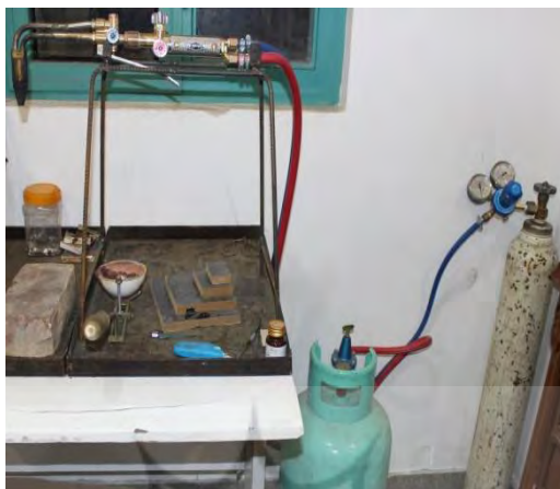
تصویر ۸- دستگاه هوا گاز

سرپیک‌ها دارای سرهای با اندازه‌های مختلف متناسب با نوع جوش هستند و به وسیله دو شلنگ به کپسول گاز و اکسیژن متصل می‌شوند.