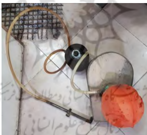
تصویر ۹- دمبوری

درجه: معمولاً قالب‌گیری با قرار دادن مدل در درجه شروع می‌شود. درجه‌ها معمولاً از جنس آلومینیم یا منیزیم ساخته می‌شوند و اکثراً دارای دیواره‌های مستقیم راهنما هستند و یا پوشش‌های جداشدنی دارند.