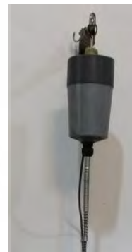
تصویر ۱۲- فرز