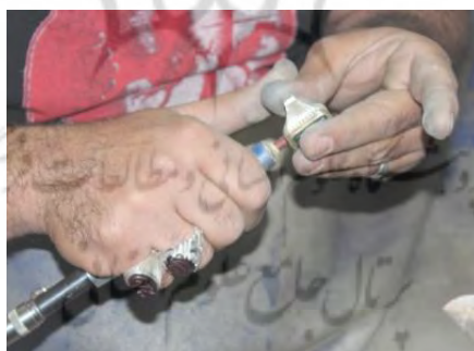
تصویر ۵۴- پوست زدن

۱۰- پوست زدن: در این مرحله با استفاده از سمباده‌های مختلف سر فرز، قسمت‌های ظریف، گوشه‌های ریز و داخل رکاب را صیقل می‌دهند. (تصویر ۵۴).