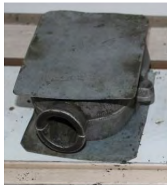
تصویر ۱۰- درجه

فرز: از دستگاه فرز و سرهای مختلف و متنوع آن برای شیار در آوردن، کنار تراشی، سمباده زدن و ... استفاده می‌شود. ۱