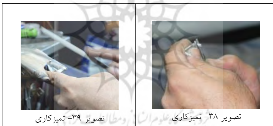
تصویر ۳۹- تمیزکاری

۲- تمیز کردن: پس از انجام ریخته‌گری و به دست آوردن شکل کلی و اولیه دو بازویی انگشتر، انگشترساز در این مرحله به کمک سوهان و سمباده به تمیز کردن و فرم دادن بازویی‌ها می‌پردازد (تصاویر ۳۸ و ۳۹ و ۴۰).