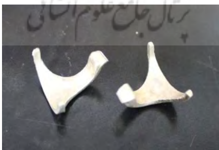
تصویر ۴۰- دو بازویی پس از انجام مرحله تمیزکاری