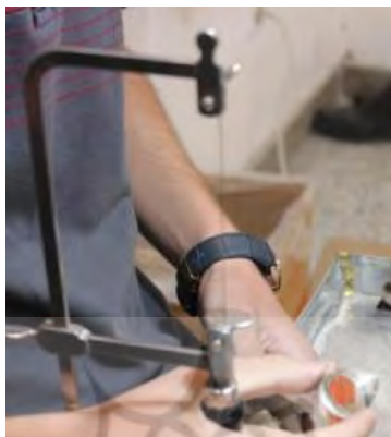
تصویر ۱۵- اره مویی

اره مویی دستی: نوعی اره است که به وسیله تیغ نازکی که بین کمان آن قرار می‌گیرد با حرکت دادن دست به‌طور قائم و جلو بردن اره شیء موردنظر را برش می‌دهد. در انگشرسازی از اره مویی بیشتر برای طرح انداختن روی انگشتر استفاده می‌شود.